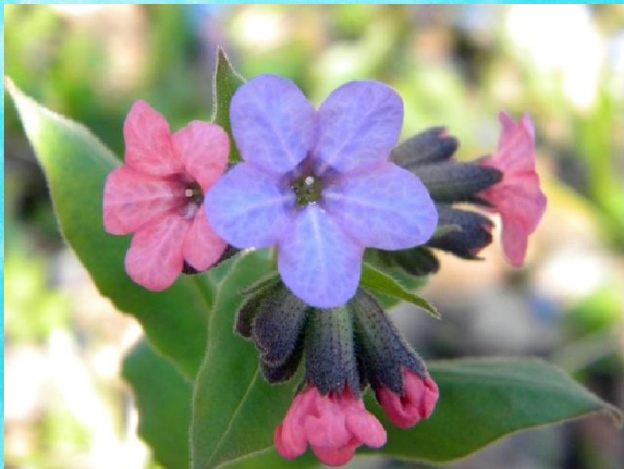
Медуница лекарственная майский