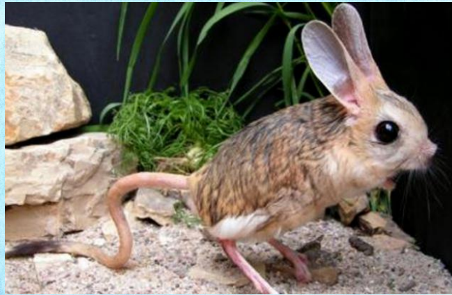
Большой тушканчик обыкновенный