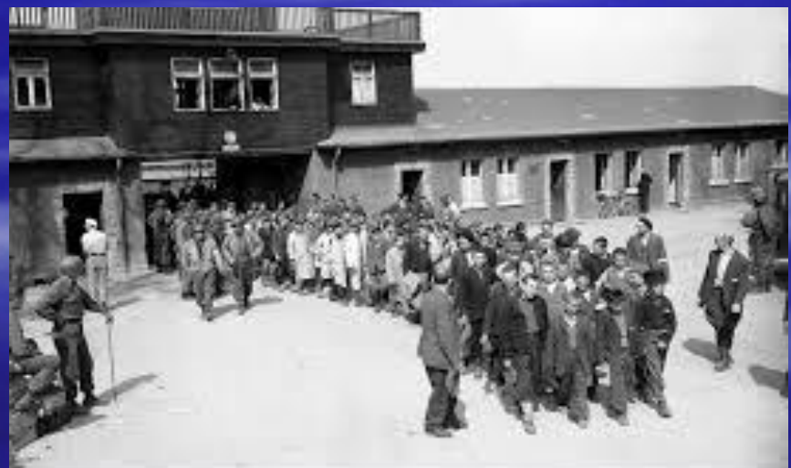
Одним из крупнейших надстроек концентрационных лагерей является Буннауэрд, он функционировал с 19 июля 1937 года. Это городок Реймаро.

Но Франкл еще накануне войны в основном завершил разработку своей теории стремления к смыслу как главной движущей силы поведения и развития личности. И в концлагере эта теория получила беспрецедентную проверку жизнью и подтверждение — наибольшие шансы выжить, по наблюдениям Франкла, имели не те, кто отличался наиболее крепким здоровьем, а те, кто отличался наиболее крепким духом, кто имел смысл, ради которого жить.