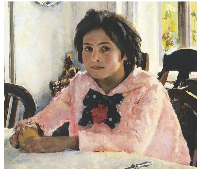
В. Серов "Девочка с персиками"