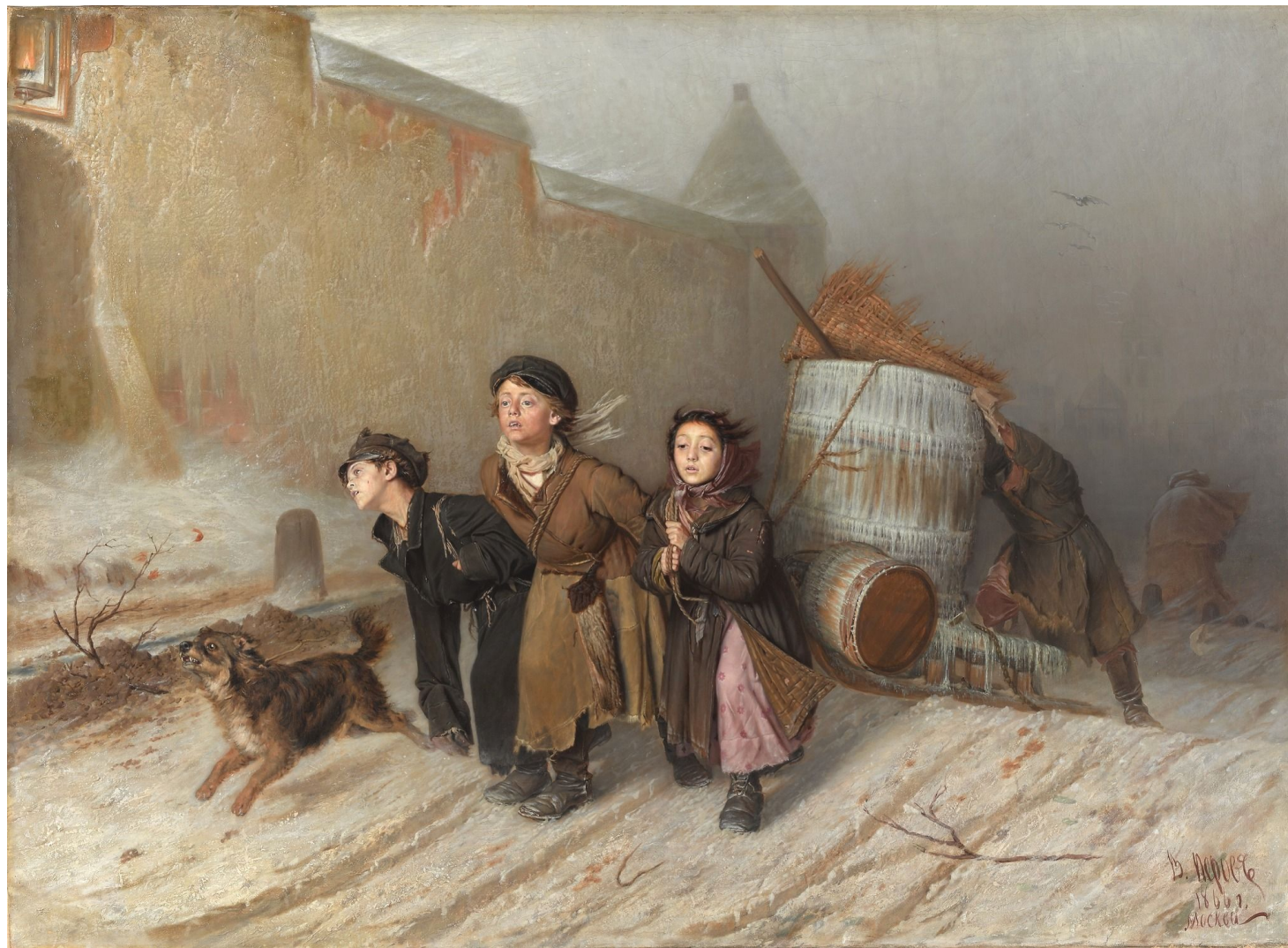
В. Перов "Тройка"