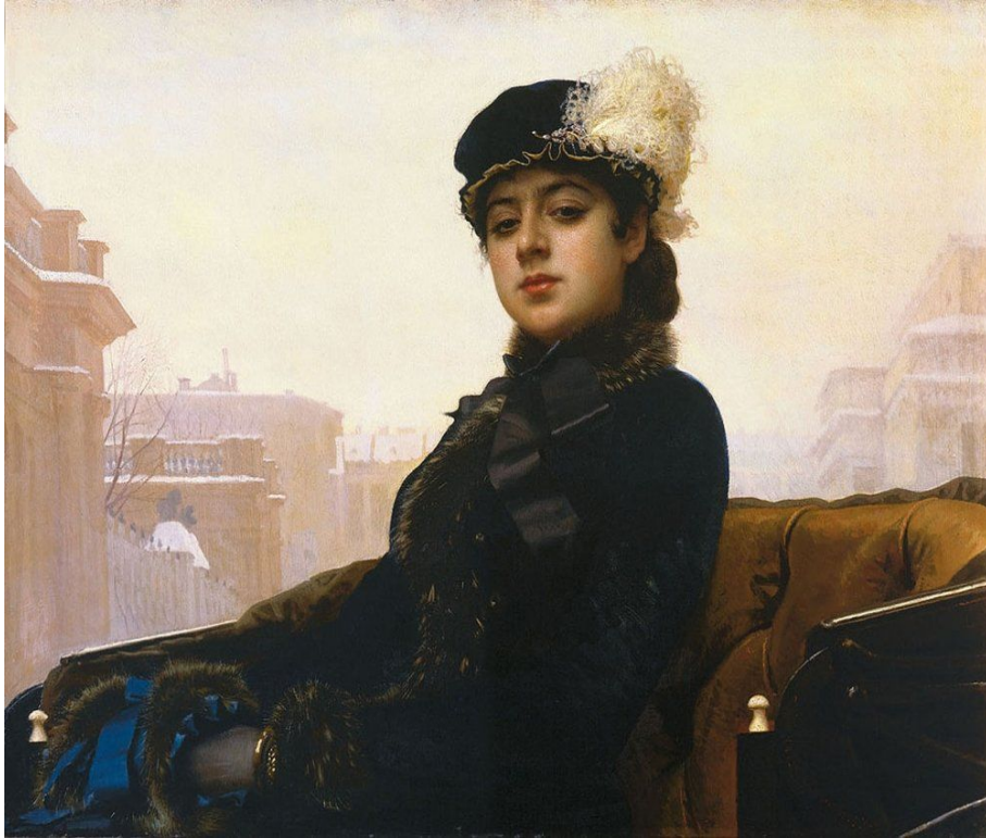
И. Крамской "Неизвестная"