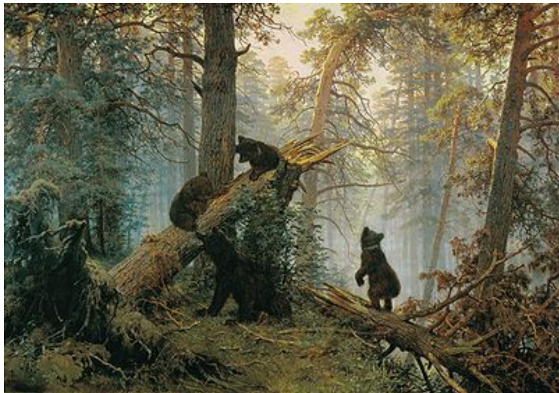
И. Шишкин "Утро в сосновом лесу"