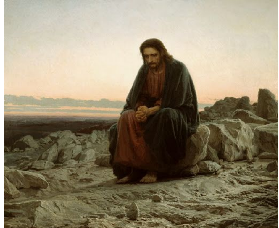
И. Крамской "Христос в пустыне"