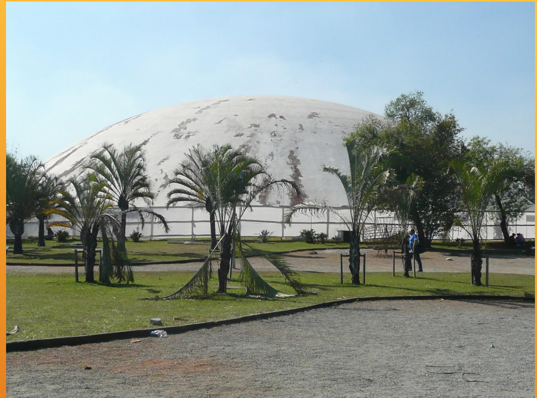
ПАВИЛЬОН ОКА В ФОРМЕ «ЛЕТАЮЩЕЙ ТАРЕЛКИ»