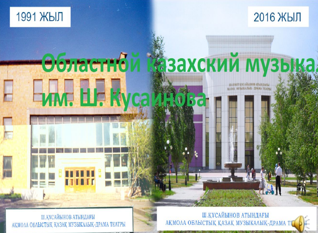
Ш. ҚҰСАЙЫНОВ АТЫНДАҒЫ АҚМОЛА ОБЛЫСТЫҚ ҚАЗАҚ МУЗЫКАЛЫҚ-ДРАМА ТЕАТРЫ