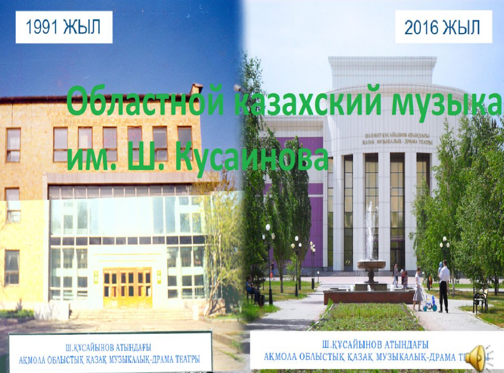
Ш. ҚҰСАЙЫНОВ АТЫНДАҒЫ АҚМОЛА ОБЛЫСТЫҚ ҚАЗАҚ МУЗЫКАЛЫҚ-ДРАМА ТЕАТРЫ