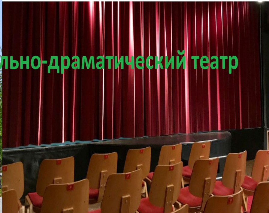
Ш. ҚҰСАЙЫНОВ АТЫНДАҒЫ АҚМОЛА ОБЛЫСТЫҚ ҚАЗАҚ МУЗЫКАЛЫҚ-ДРАМА Т