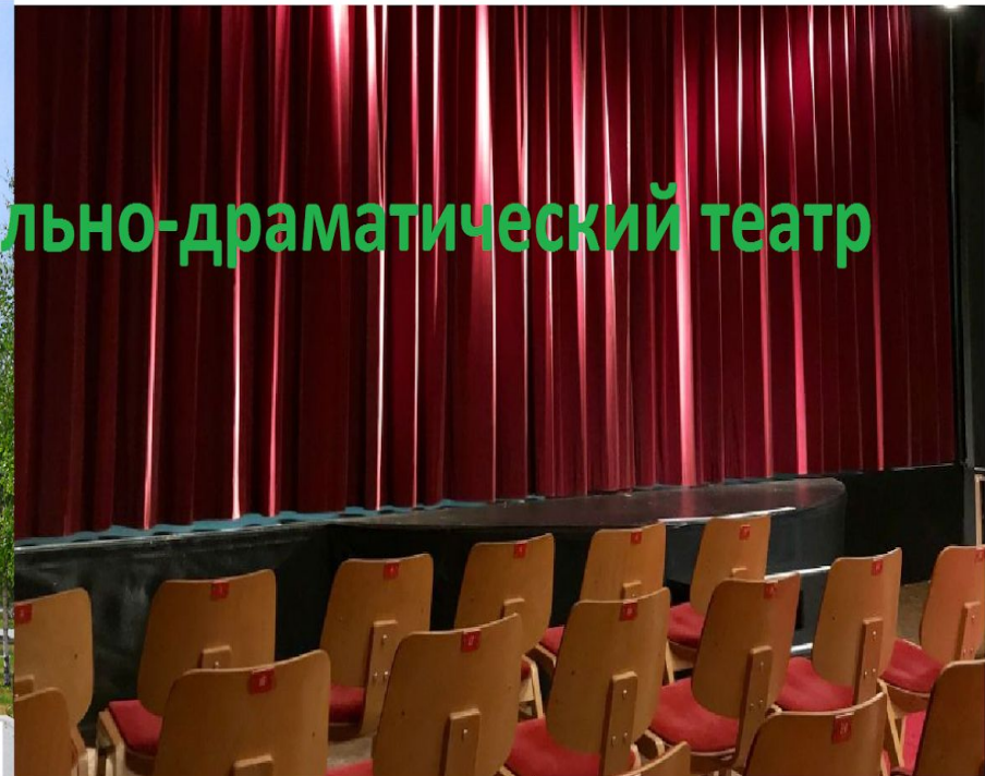
Ш. ҚҰСАЙЫНОВ АТЫНДАҒЫ АҚМОЛА ОБЛЫСТЫҚ ҚАЗАҚ МУЗЫКАЛЫҚ-ДРАМА ТЕАТРЫ