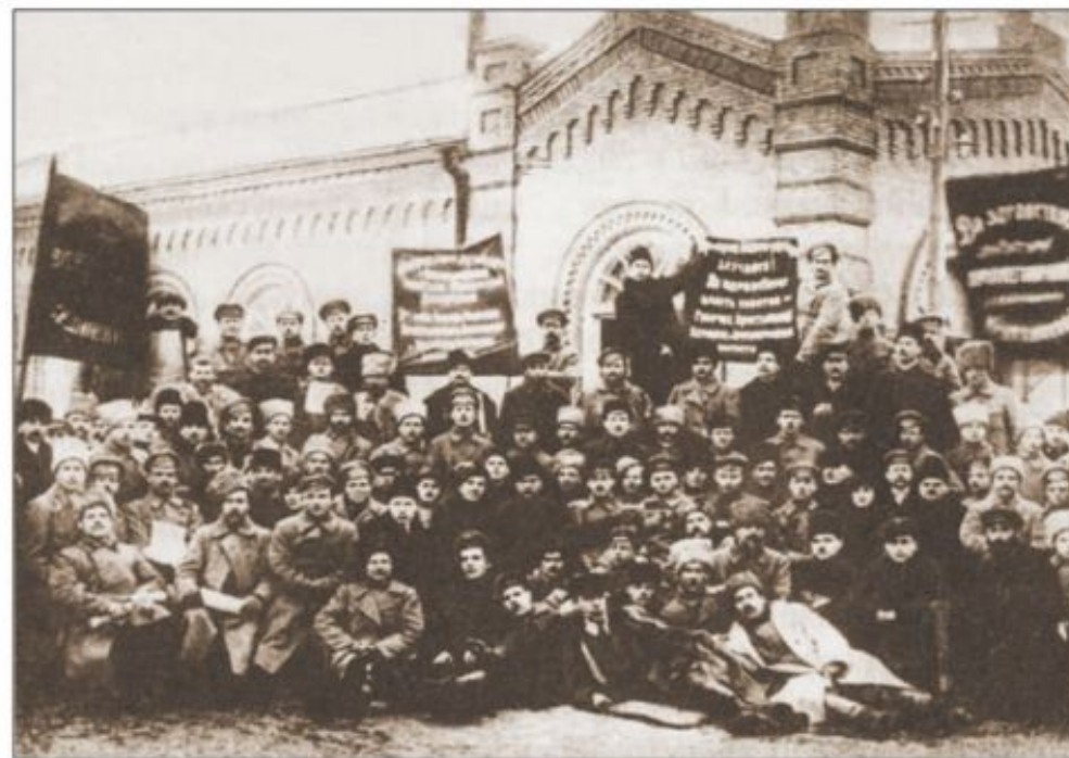
Делегаты I Всебелорусского съезда Советов. Минск. 2—3 февраля 1919 г.