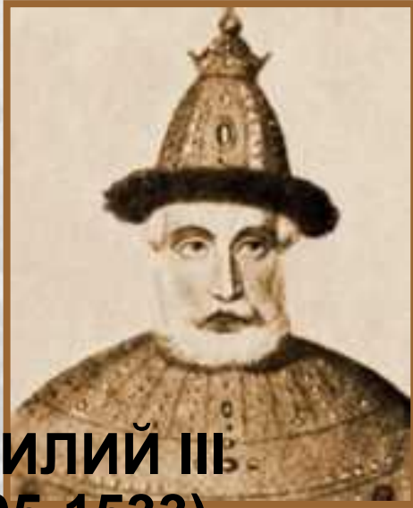
ВАСИЛИЙ III (1505-1533)