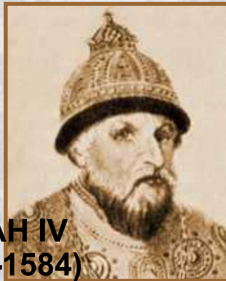
ИВАН IV (1533-1584)