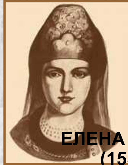
ЕЛЕНА ГЛИНСКАЯ (1533-1538)