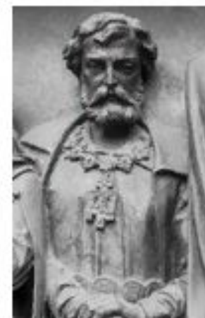
А. Ф. Адашев