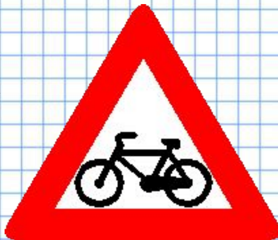
Пересечение с велосипедной дорожкой