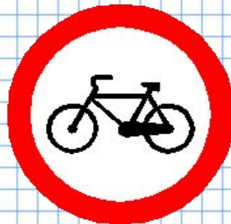
Движение на велосипеде запрещено