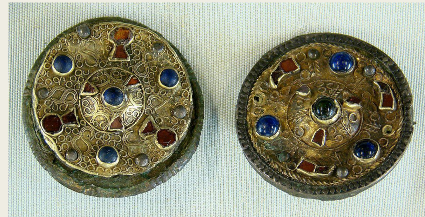
Предмет культуры Франков

Так как на покоренных территориях проживало немало римлян, то это вызвало некие споры и конфликты между народами. Несмотря на это, народы все же позаимствовали друг у друга большое количество знаний и навыков. Переселение внесло лепту в формирование единой латинской языковой системы, на основе которой возникли многие языки Западной Европы.