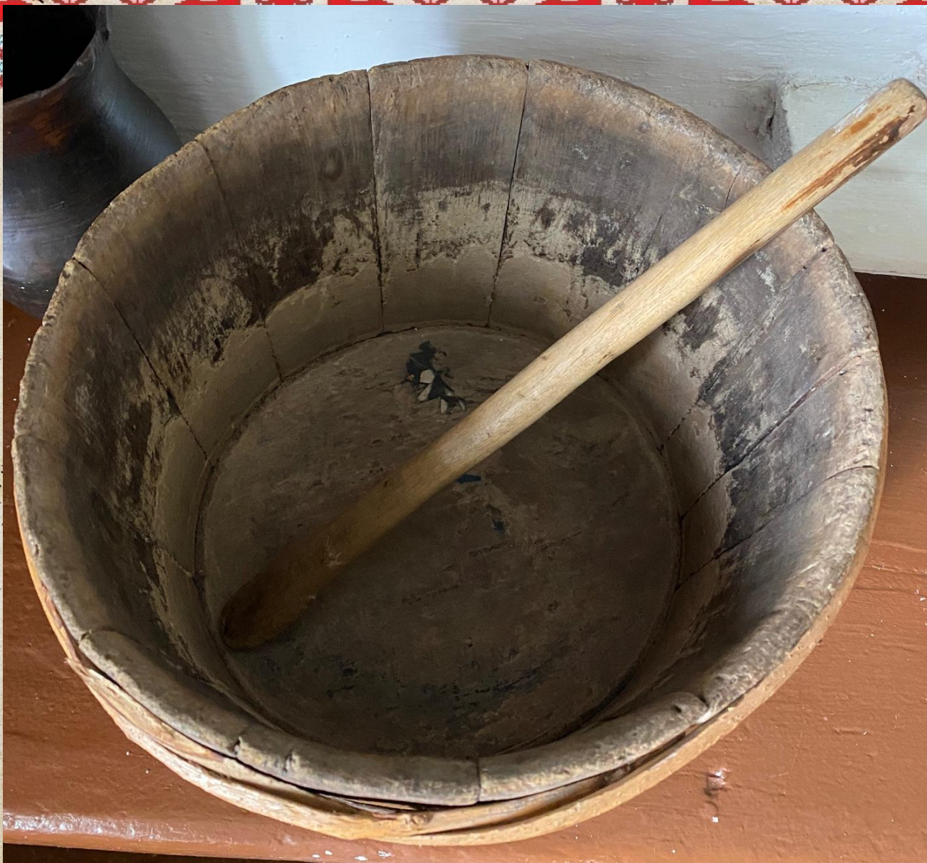
Веселка в Ермаковском филиале музея-заповедника «Шушенское»