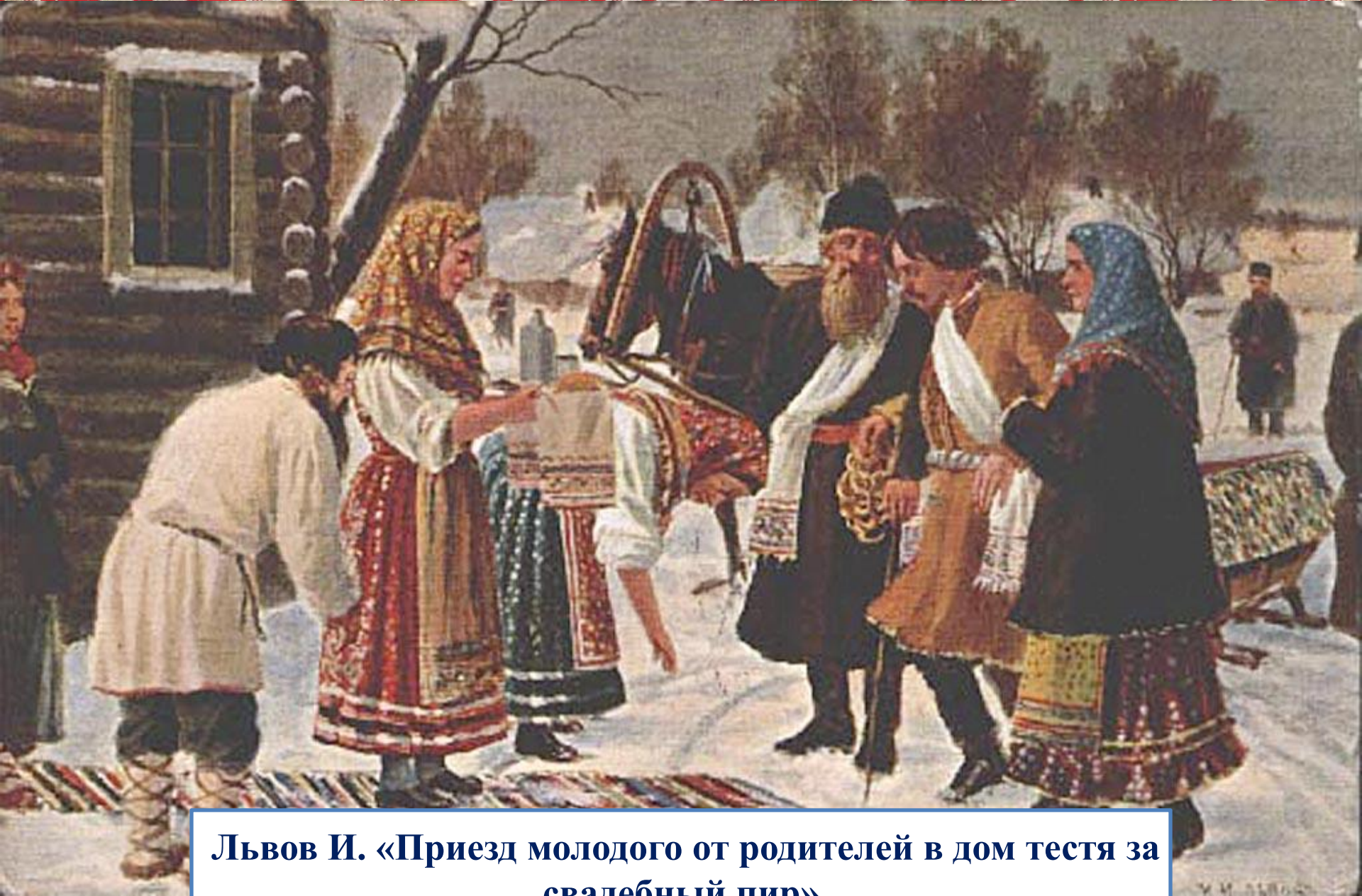
Львов И. «Приезд молодого от родителей в дом тестя за свадебный пир»