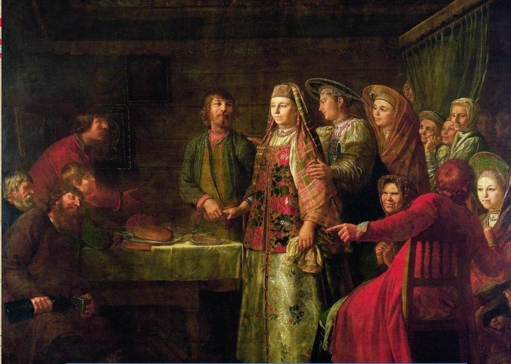
Шибанов М. «Празднество свадебного договора»