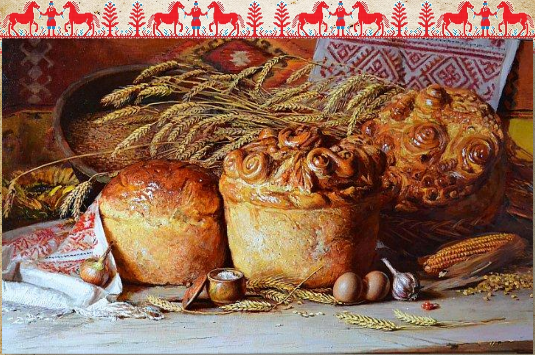
Николаев Ю.В. «Хлеб к празднику»