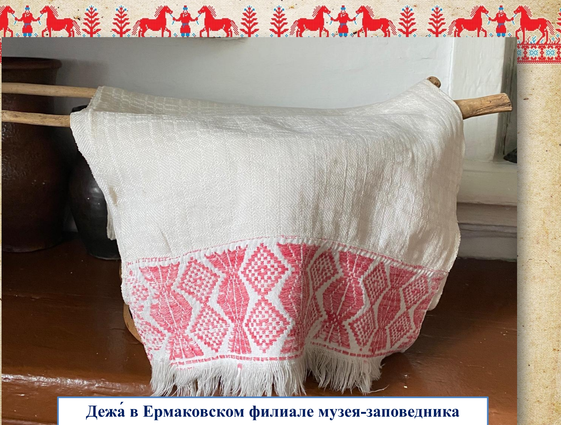
Дежа́ в Ермаковском филиале музея-заповедника «Шушенское»