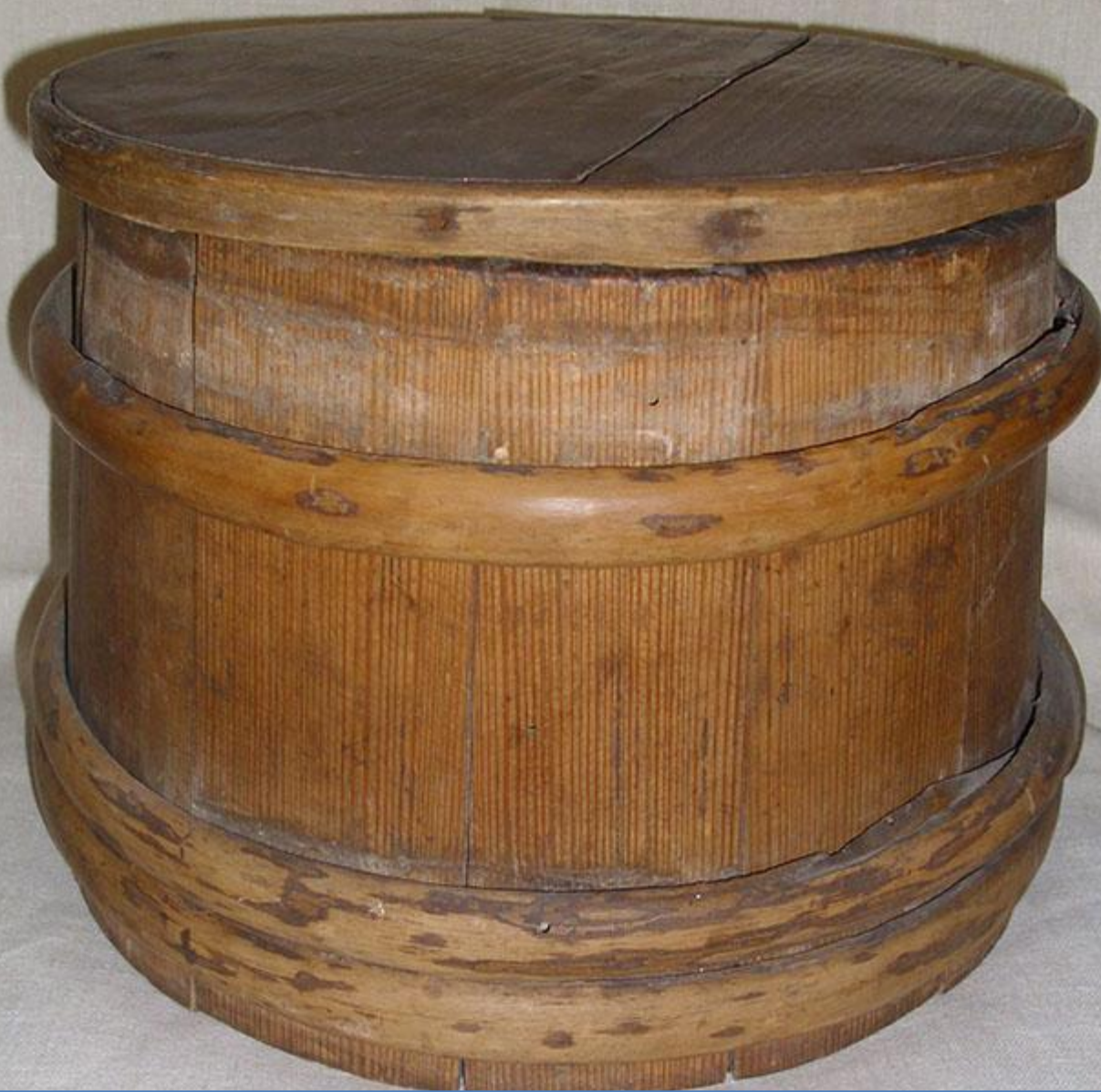
Дежа с крышкой