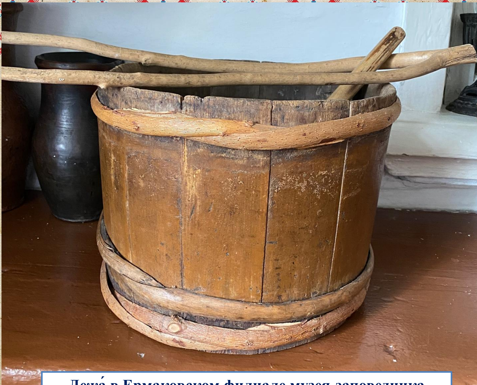
Дежа́ в Ермаковском филиале музея-заповедника «Шушенское»