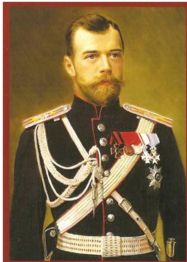
Николай II (1894 – 1917)