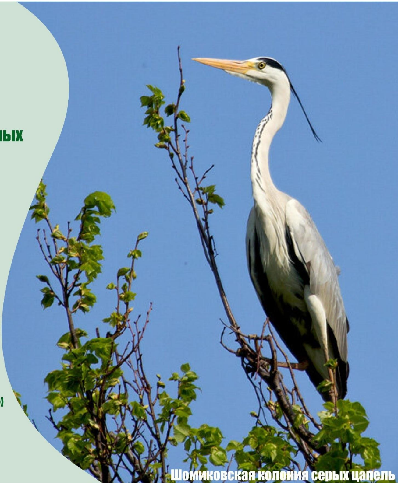
Шомиковская колония серых цапель