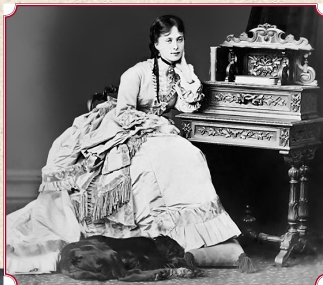
Княжна Е. М. Долгорукова. Фотография. Середина 1870-х гг.