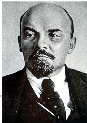
В.И. Ленин 1870–1924 гг.

В 1923 г. было образовано союзное правительство — Совет народных комиссаров СССР.