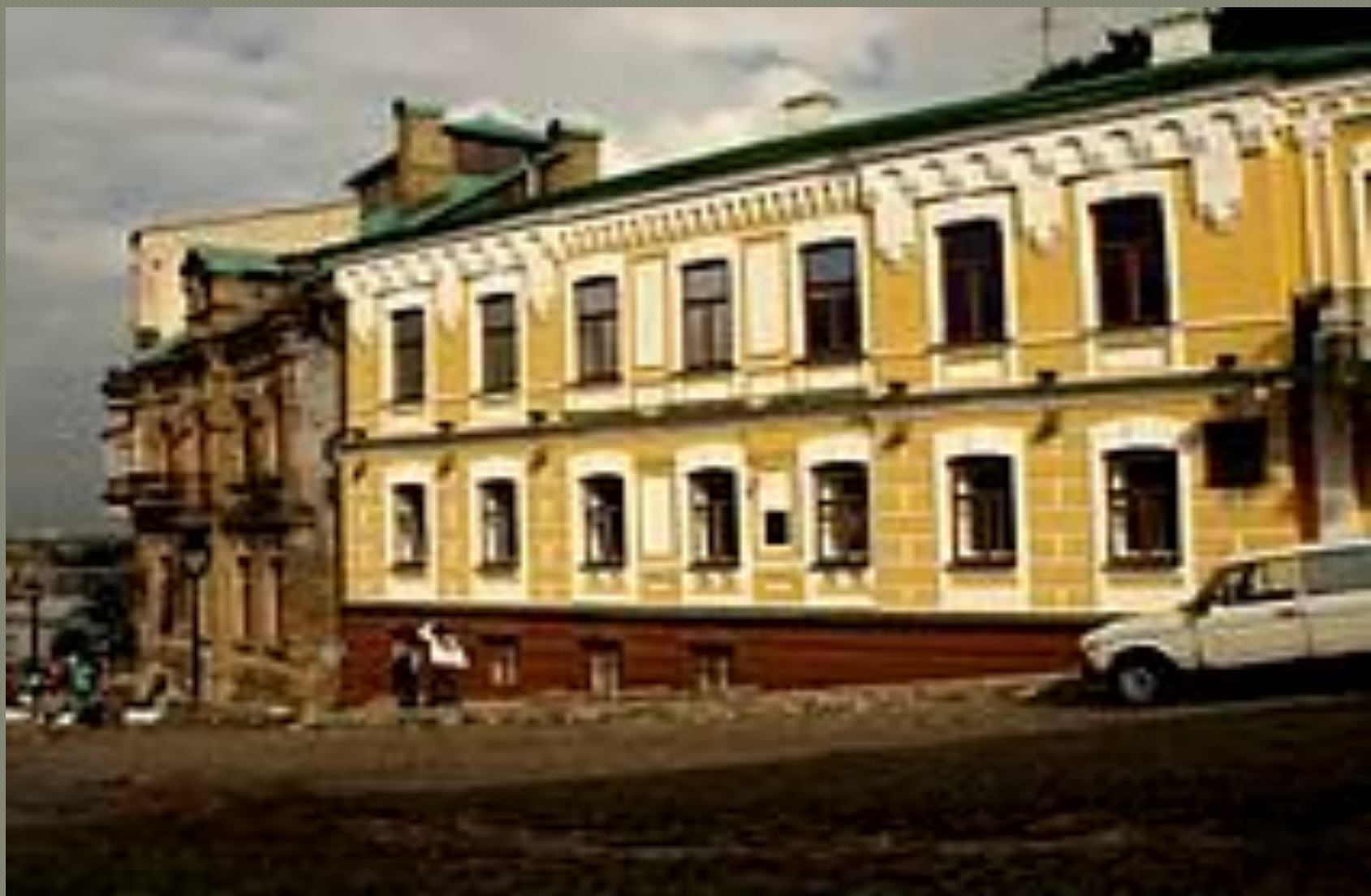
Дом в Киеве, в котором в 1906—1921 гг. жил М. Булгаков