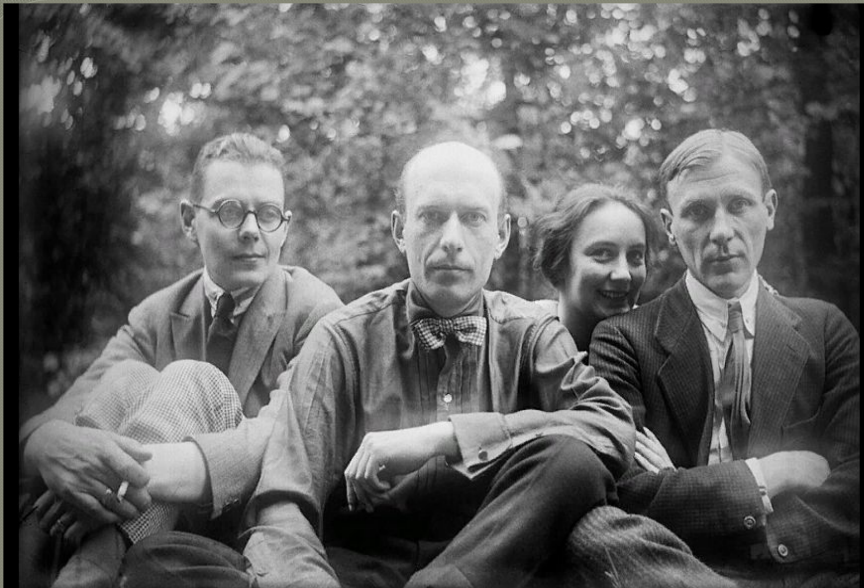
С. Топленинов, Н. Лямин, Л. Белозерская, М. Булгаков. Останкино. 1926 г.