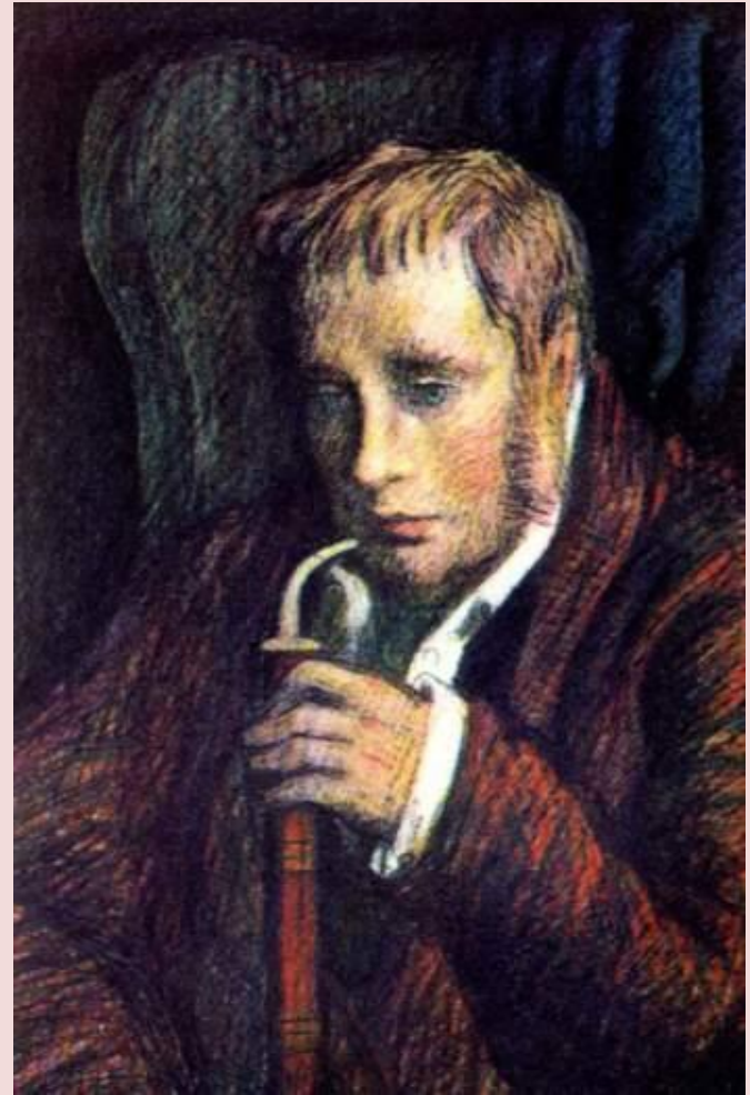
Ю. С. Гершкович. Обломов.