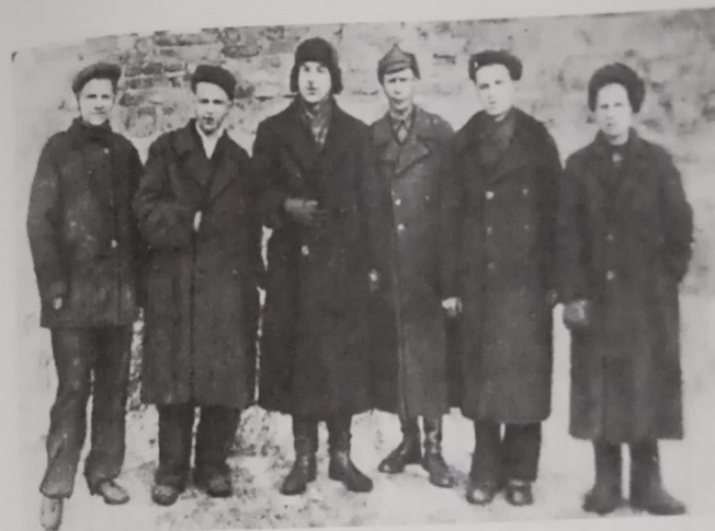
№ 21. Работники Молотовского телефонного завода, подавшие заявление о зачислении их добровольцами в Уральский танковый корпус. г. Молотов. Март 1943 г.