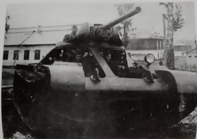
№ 64. Курсанты внутри разобранного танка Т-34. Киевское танкотехническое училище. г. Кунгур, Молотовская область. 1943 г. КТА. Ф. 477. Оп. 1. Д. 289. Л. 16.