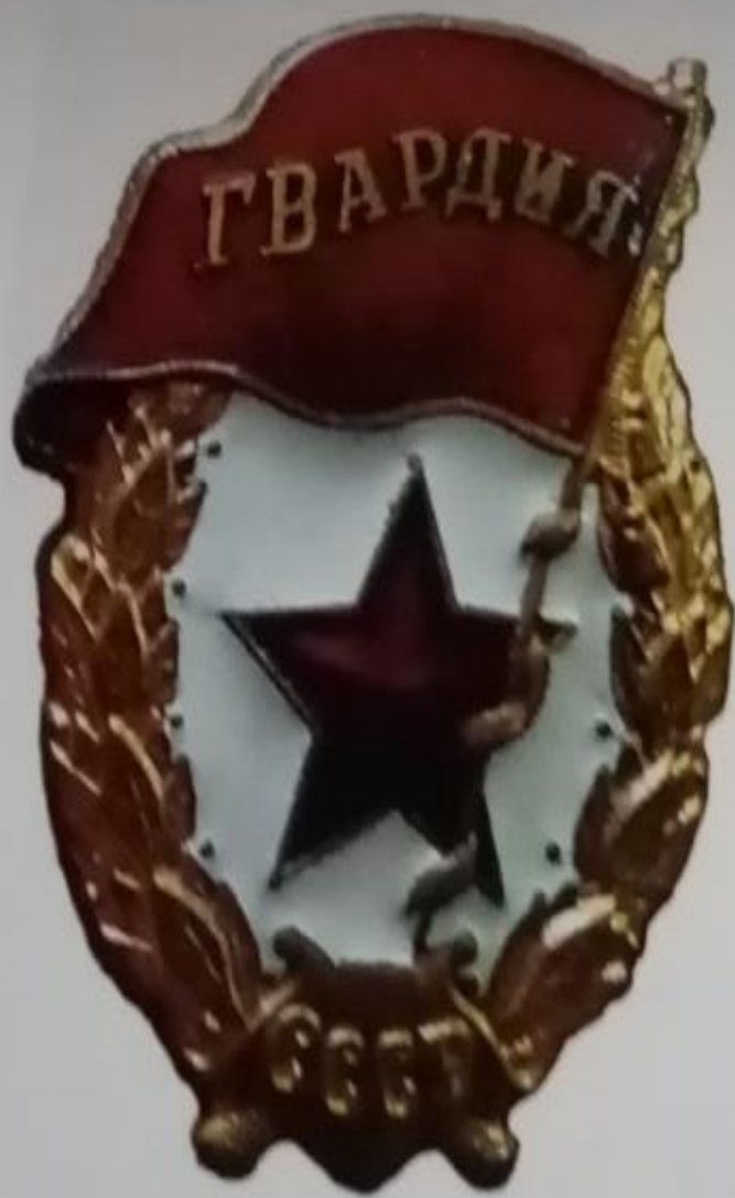
Нагрудный знак «Гвардия» образца 1942 г. Из экспозиции Пермского краеведческого музея.