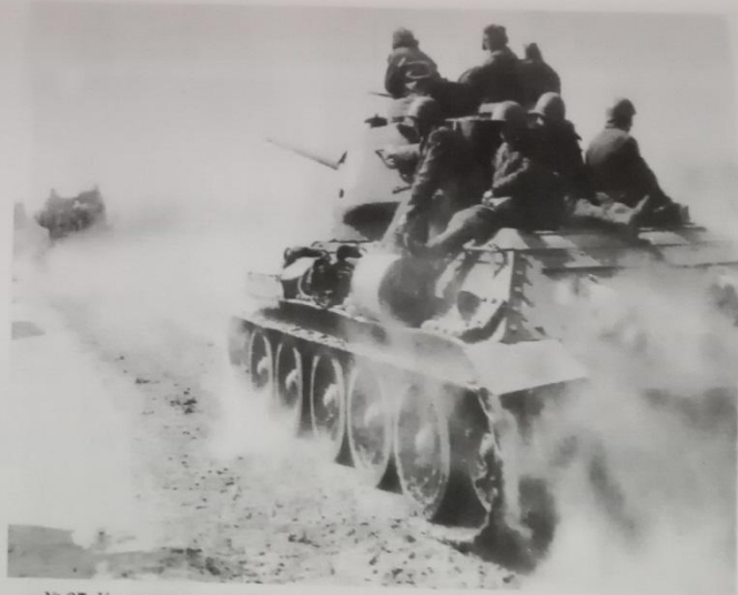
№ 97. Колонна танков Уральского добровольческого танкового корпуса. б/д ГАПК. Ф. 5. Оп. 5. Д. 2457. Л. 2.