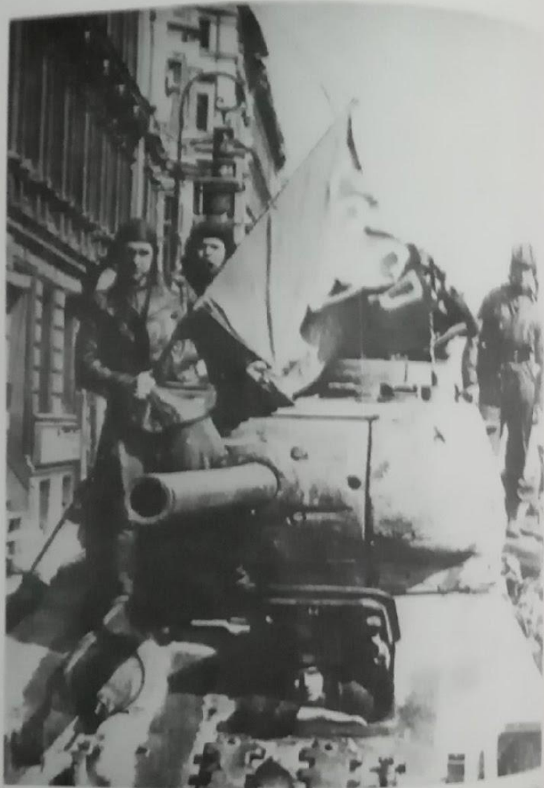
№ 134. Военнослужащие Молотовской танковой бригады на одной из улиц г. Берлина. Май 1945 г. Перед АСПИ. Ф. 8043. Оп. 11. Д. 5. Л. 1.