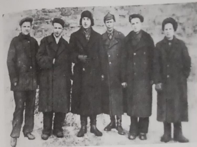
№ 21. Работники Молотовского телефонного завода, подавшие заявление о зачислении их добровольцами в Уральский танковый корпус. г. Молотов. Март 1943 г.