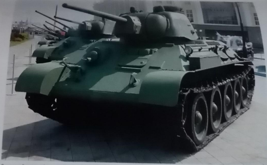
Советский средний танк Т-34-76, стоявший на вооружении Молотовской танковой бригады. Из экспозиции Музея военной техники в г. Верхняя Пышма Свердловской области.