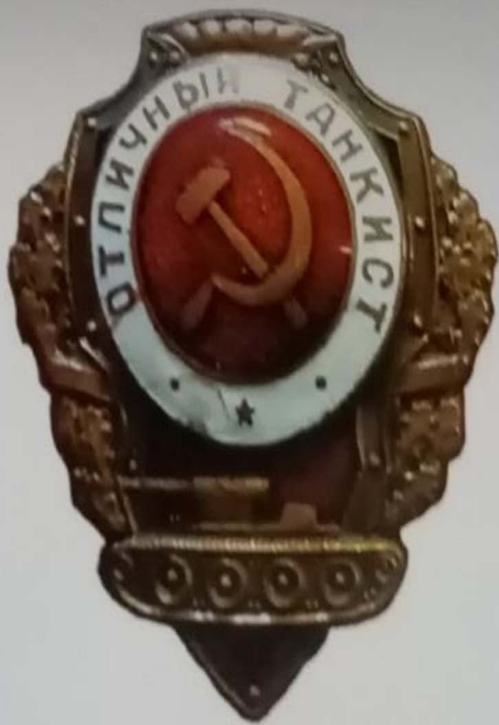
Нагрудный знак «Отличный танкист» образца 1942 г. Из экспозиции Пермского краеведческого музея.