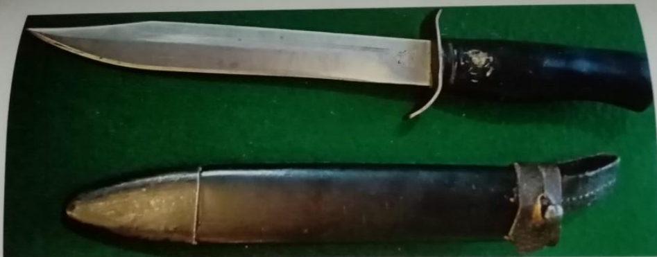
Нож кинжалный, тип Н-41, известный как «черный нож», находившийся на вооружении всех военнослужащих Уральского Добровольческого танкового корпуса. Из экспозиции Пермского краеведческого музея.