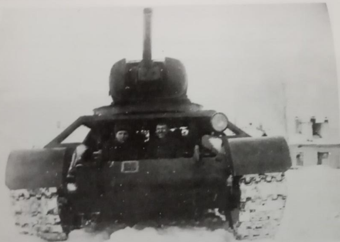
№ 65. Разобраный танк Т-34, на котором проводились занятия в Киевском танкотехническом училище. Вид спереди. г. Кунгур, Молотовская область. 1943 г. КТА. Ф. 477. Оп. 1. Д. 289. Л. 16.