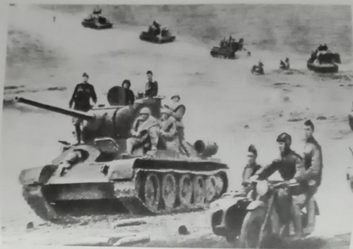
№ 96. Колонна танков Уральского добровольческого танкового корпуса выдвигается на выполнение боевого задания. Орловская область. 1943 г.