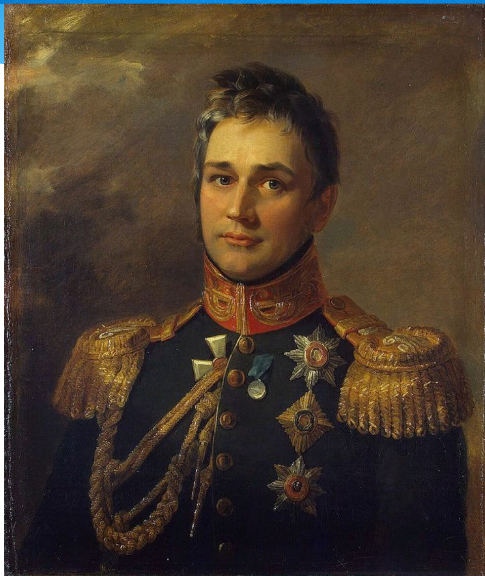
Архитектор Эдуард Блор