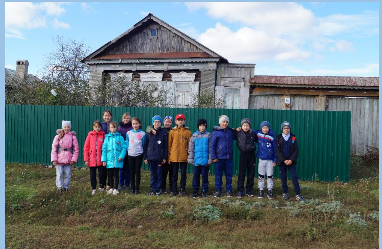
Дом матери Эдуарда Николаевича (д.К-Шемякино, 2018)