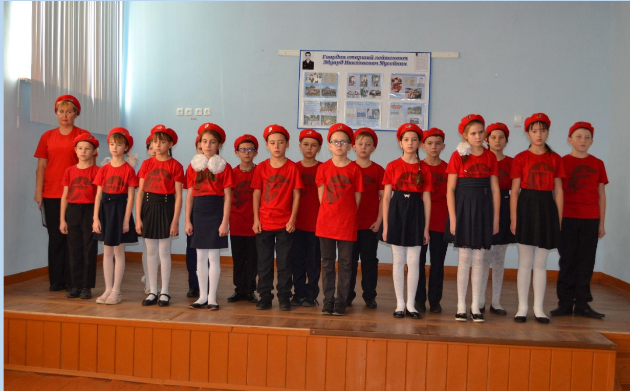
Юнармейцы 5 класса