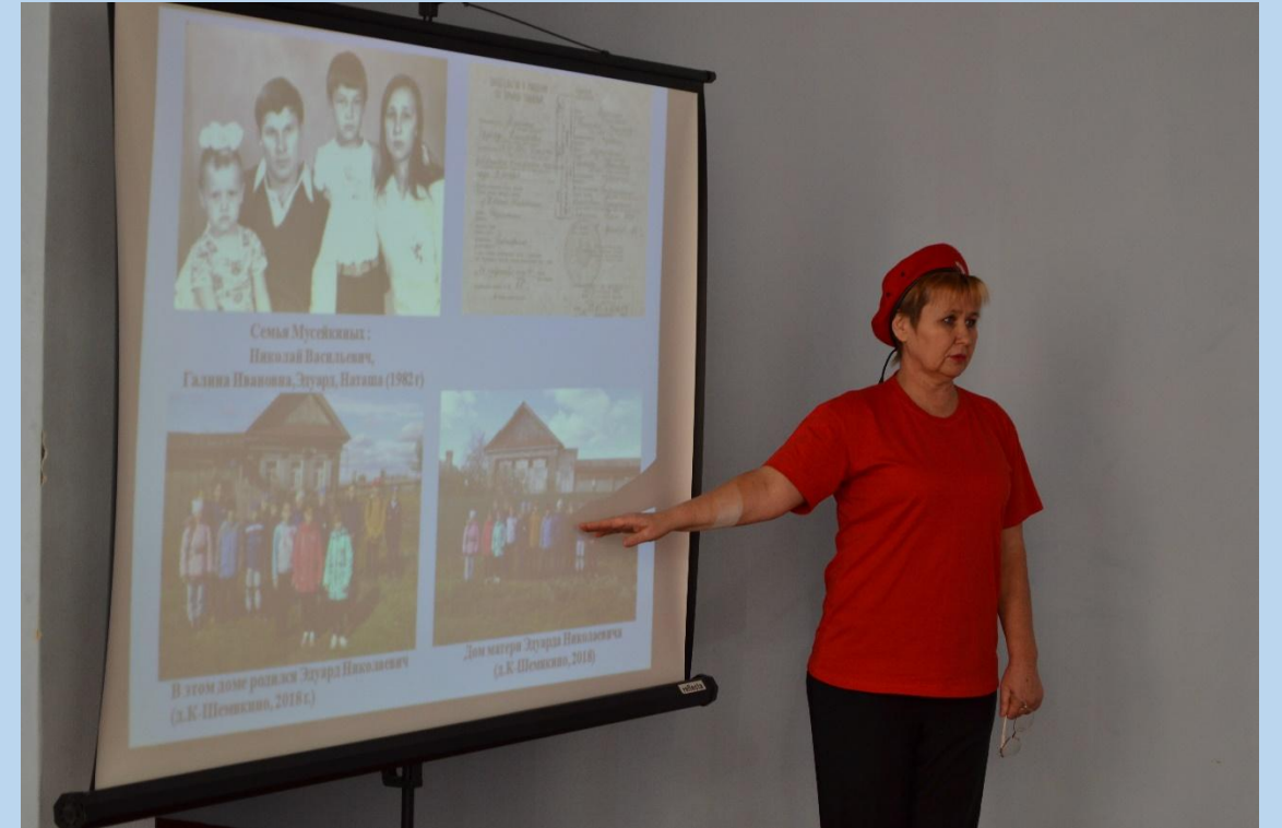
Классная руководительница 5 класса