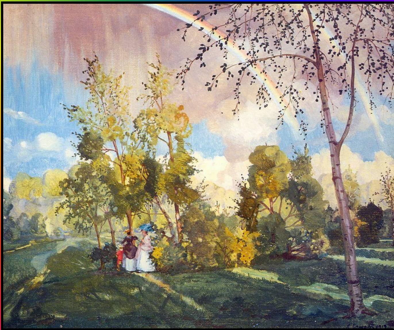
Константин Андреевич Сомов «Пейзаж с радугой»