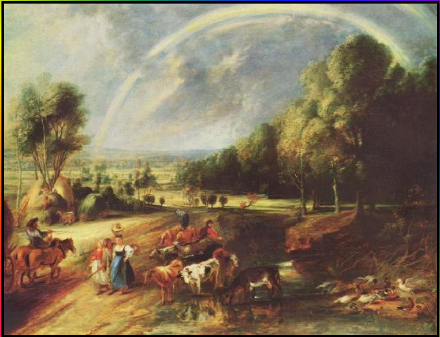
Питер Пауль Рубенс «Пейзаж с радугой»