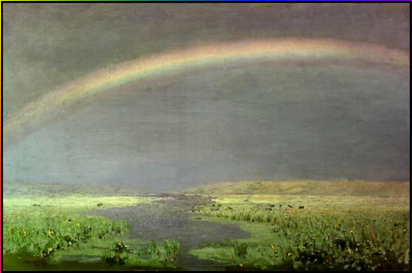
Архип Иванович Куинджи «Радуга»