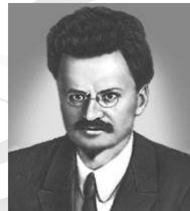
Чапаев Ворошилов Фрунзе Троцкий