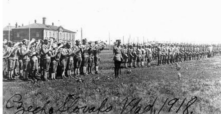
Чехословацкий корпус во Владивостоке.