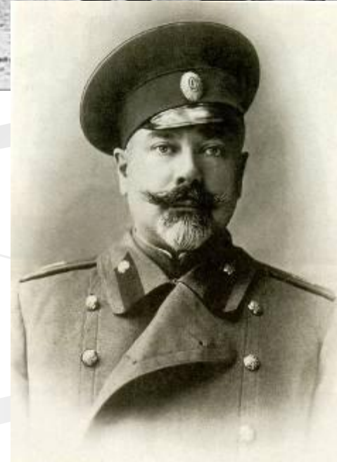
Генерал А.И.Деникин и его Добровольческая армия.