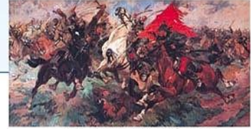
Н. С. Самокиш. Атака. Бой за знамя