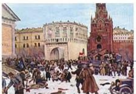
К. Ф. Юон. Вступление в Кремль отрядов Красной гвардии

1917 Октябрьская революция. Установление советской власти в России