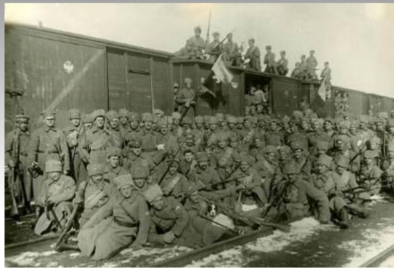
Бойцы 5-го полка Чехословацкого корпуса на захваченном ими вокзале в Пензе. Май, 1918 г.

25 мая мятеж начался в Мариинске, совместно с эсерово-белогвардейскими отрядами чехословацкие войска захватили ряд городов, где находился золотой запас Республики.