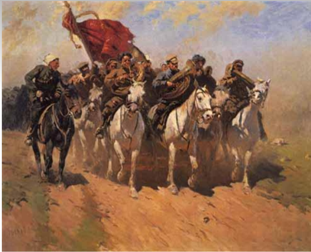
Первая Конная армия С.М.Буденного

Самым тяжелым и решающим в ходе гражданской войны был 1919 г. У Советской России не было мирных границ. Она оказалась в сплошном вражеском окружении.