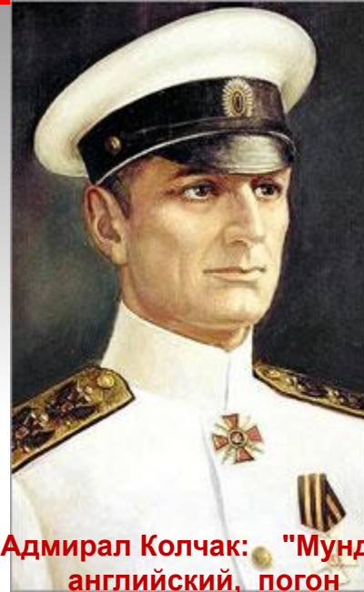
Адмирал Колчак: "Мундир английский, погон российский, табак японский, правитель омский"

А.В. Колчак начал наступление в Приуралье. 15 декабря войска А. В. Колчака взяли г. Пермь, но уже 31 декабря наступление колчаковцев было приостановлено Красной Армией. На Востоке фронт временно стабилизировался.