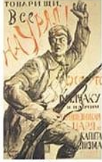
П. Киселис. Плакат «Товарищи, все на Урал!»