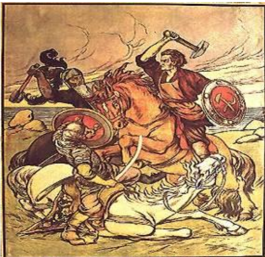
БОРЬБА КРАСНОГО РЫЦАРЯ С ТЕМНОЙ СИЛОЮ.

Социальную базу советского лагеря составляли: рабочие центрально-промышленного района, значительная часть крестьянства , что в итоге во многом предопределило победу красных, часть офицерского корпуса русской армии (около 1/3 его состава), мелкое чиновничество .