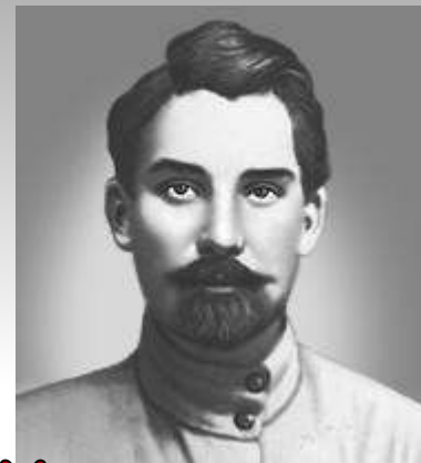
Буденный Сталин Тухачевский Щорс