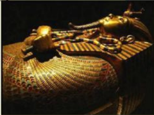
Первый саркофаг из позолоченного дерева