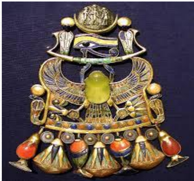
Золотая массивная подвеска

Массивная золотая подвеска, украшенная полудрагоценными камнями и цветной смальтой. Крупный скарабей (халцедоновый), с пестрыми распростертыми крыльями и лапами коршуна, держащими знак "вечность" и букет цветов, поддерживает ладью луны. В ладье знак "левый глаз", означающий луну ("правый глаз" - солнце), с уреями по сторонам. Над ним - лунный диск с изображением фараона, стоящего между богами Гором и Тотом. На голове фараона и Тота диск луны, у Гора - диск солнца. В нижней части большой подвески находятся более мелкие массивные подвески в виде цветков лотоса и голубых кружков.