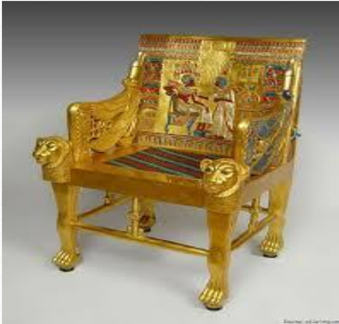
Золотой трон Тутанхамона

Изготовлен ремесленниками Ахетатона - столицы Египта при фараоне Эхнатоне. На задней спинке трона изображены царские уреи, растения и птицы с берегов Нила