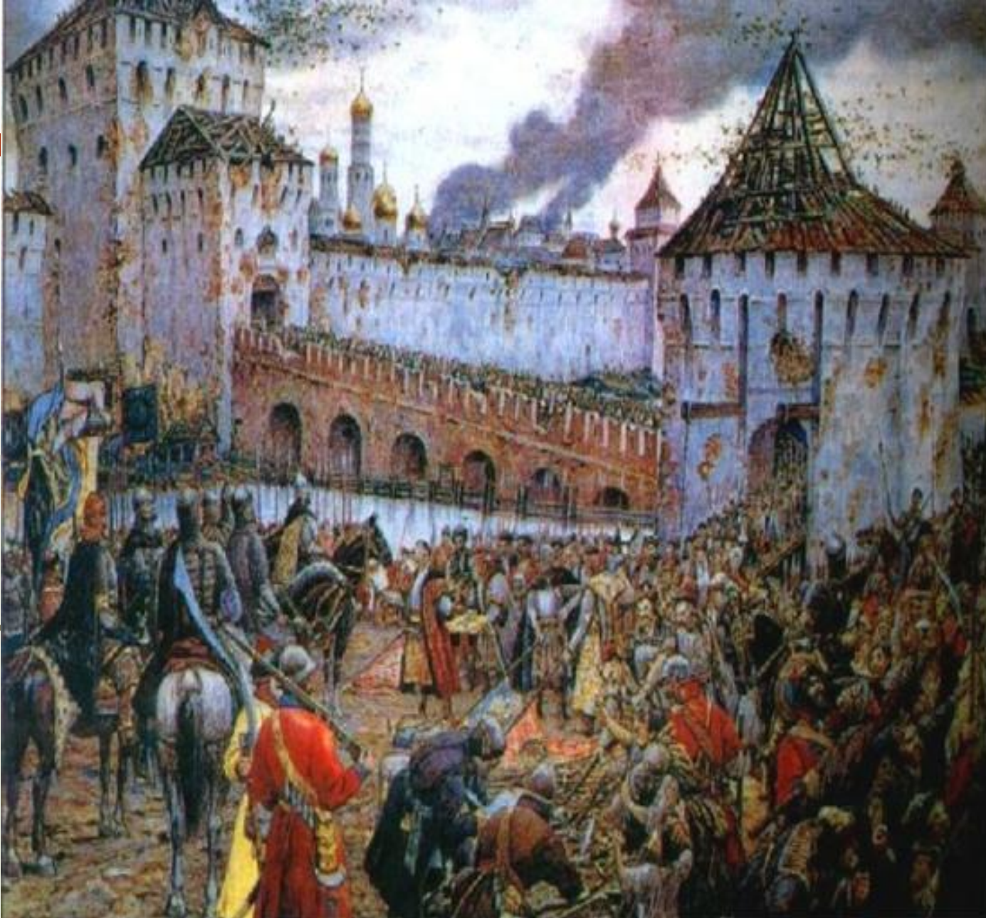
Польские паны, осажденные в Московском Кремле, сдаются русскому ополчению.