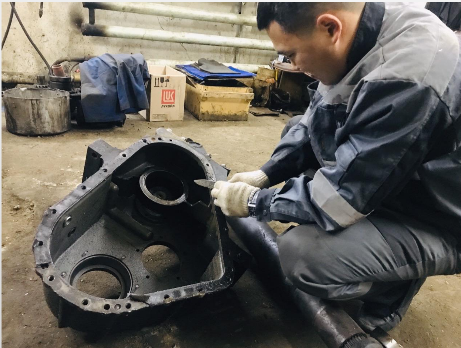
Очистка раздаточной коробки