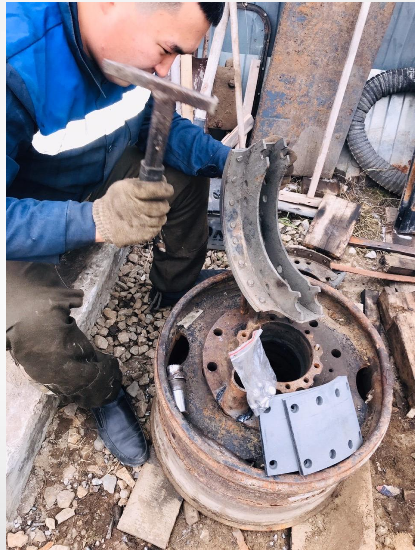
Ремонт тормозных колодок