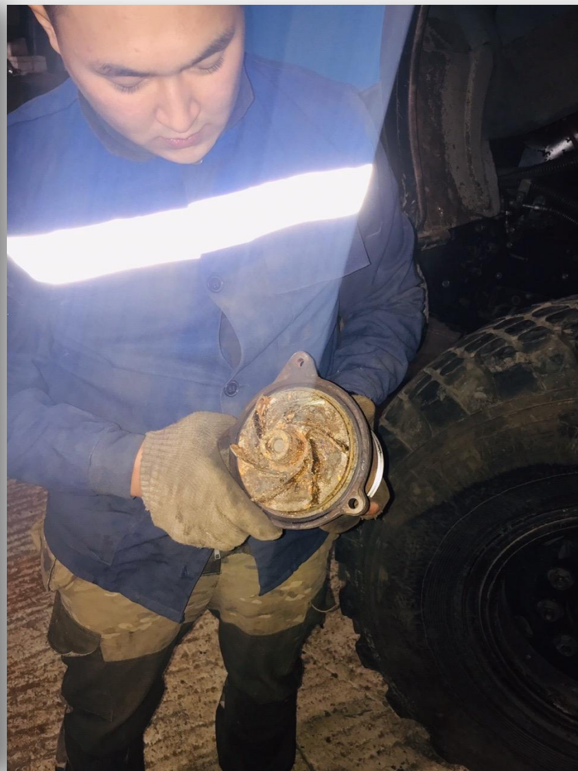
Снятие водяного насоса