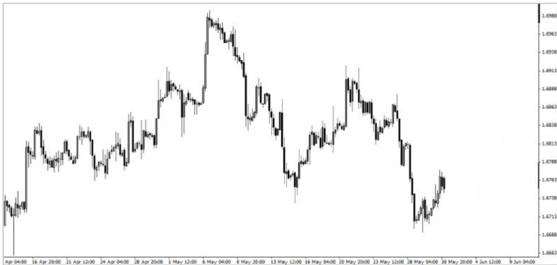
Рис.2 Тот же участок на свечном графике