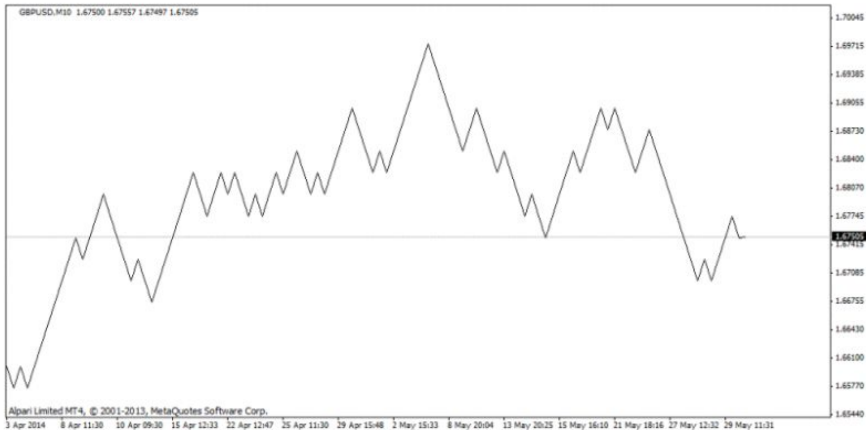
Рис.1 Квантовый график по GBP/USD с размером кванта 25 пунктов