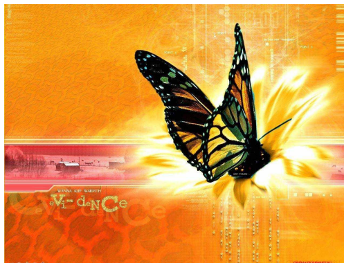
Бабочка (ж. р)