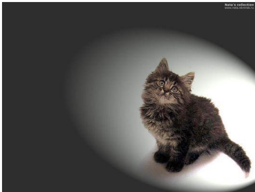
Кот (м. р)

НО: врач, инженер, директор -м.р.(независимо от пола лица)