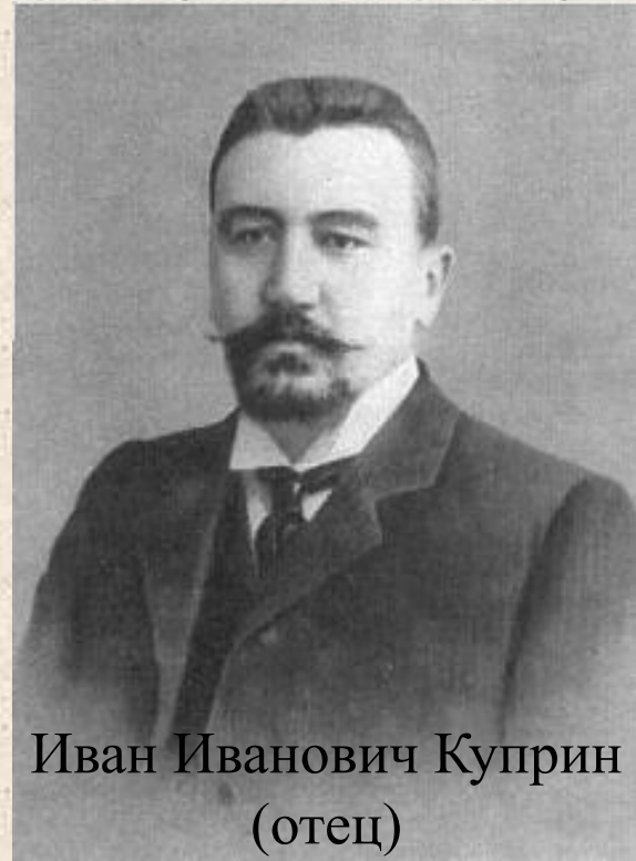
Иван Иванович Куприн (отец)