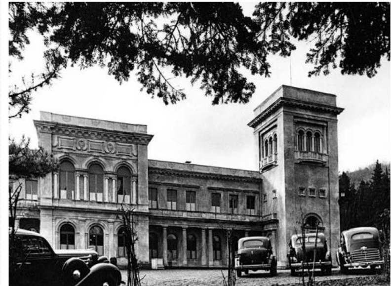
Ливадийский дворец в Крыму

К этому времени исход войны, по большому счёту, был уже ясен. Основное внимание Иосиф Сталин, Франклин Рузвельт и Уинстон Черчилль уделили не обсуждению вопросов ведения совместных военных действий, а определению новых границ на тех территориях, которые были оккупированы нацистской Германией.