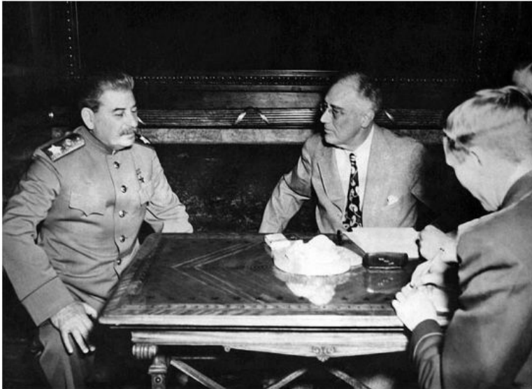
И. В. Сталин на переговорах с президентом США Ф. Рузвельтом во время Ялтинской конференции