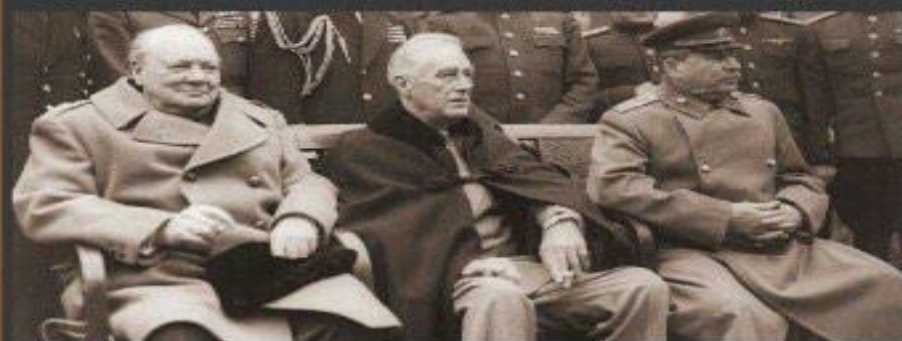
У. Черчилль (Великобритания)