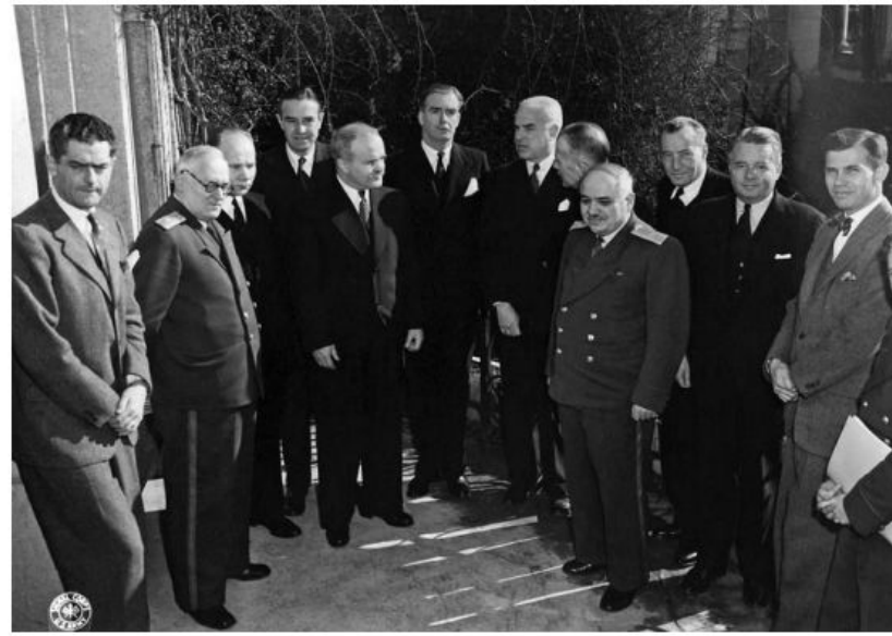
Советские, американские и британские дипломаты во время Ялтинской конференции