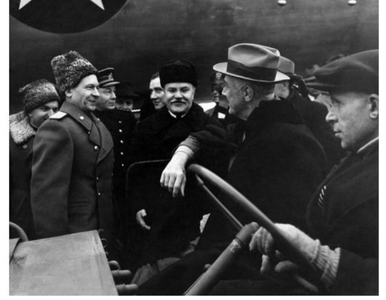
Встреча Ф. Рузвельта на аэродроме Саки

В марте зона оккупации была выделена и для Франции. Также обсуждался вопрос об отделении от Германии Восточной Пруссии.