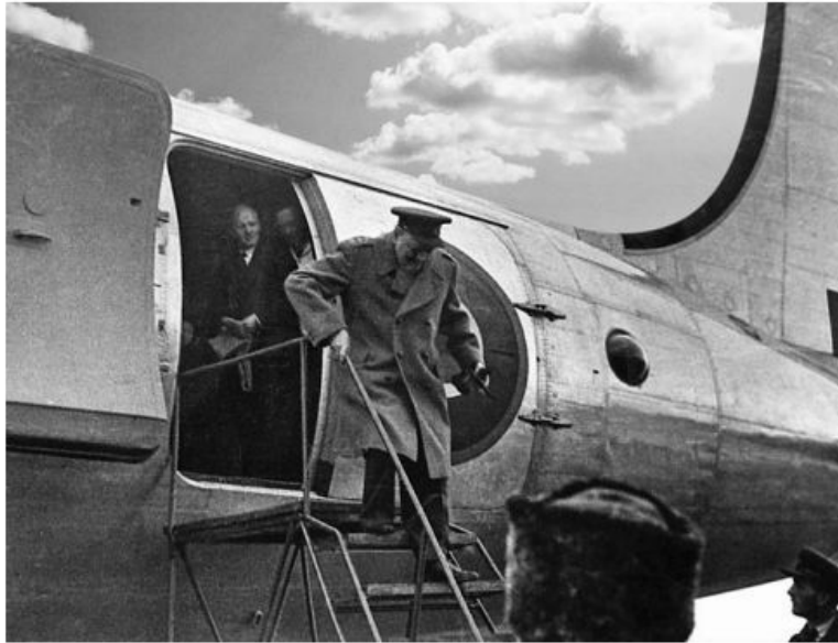
Прибытие У. Черчилля на аэродром Саки