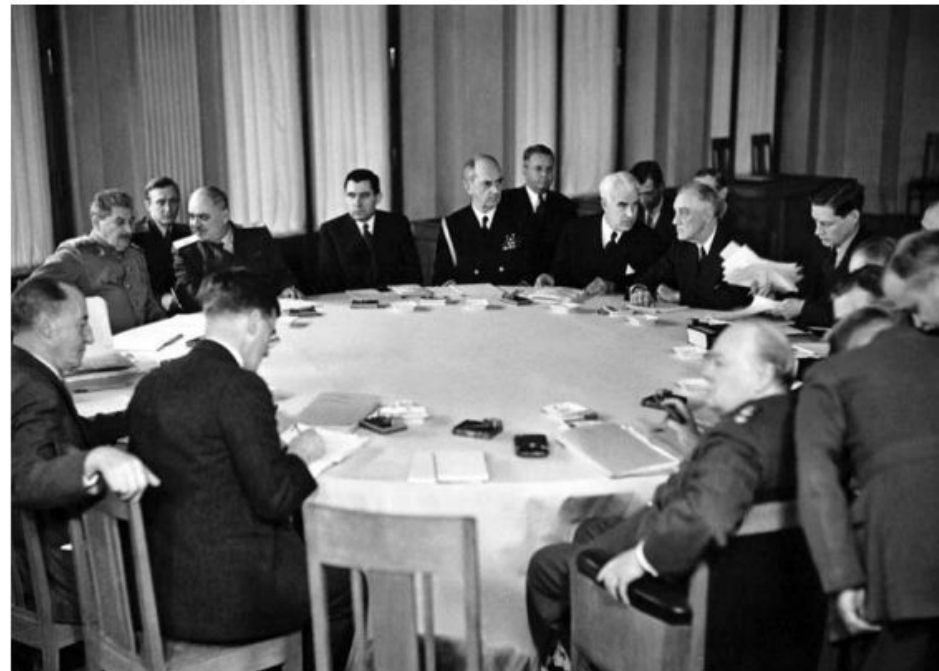
Лидеры большой тройки за столом переговоров на Ялтинской конференции