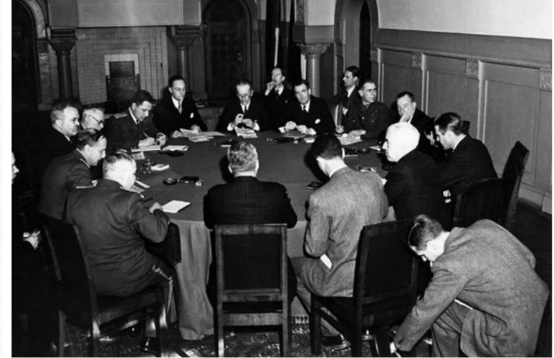
Нарком иностранных дел СССР В. М. Молотов, государственный секретарь США Э. Стеттиниус и министр иностранных дел Великобритании А. Иден на переговорах в Ялте

В Ялте была подписана «Декларация об освобождённой Европе». Это документ предполагал, что после войны будет соблюдаться право народов на суверенное развитие, а союзники будут совместно помогать им в этом, уважая их политический выбор. В реальности, в зонах своего влияния каждая из сторон поддерживала те силы, которые были им идеологически близки, и Европа разделилась на Восток – социалистический лагерь и Запад – лагерь капитализма.