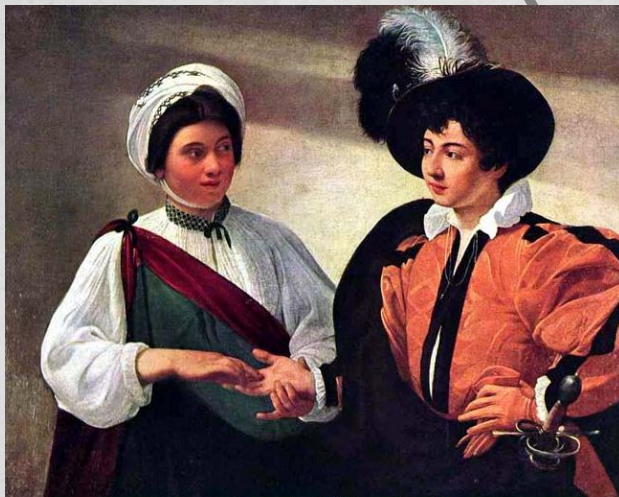
Караваджо. Гадалка. 1588-1589 годы. Лувр, Париж.