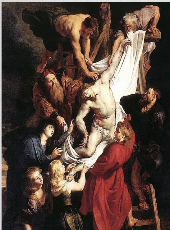
Рубенс. «Снятие с креста». 1612. Эрмитаж, Санкт-Петербург.