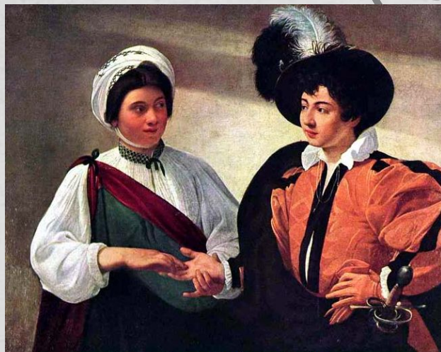
Караваджо. Гадалка. 1588-1589 годы. Лувр, Париж.