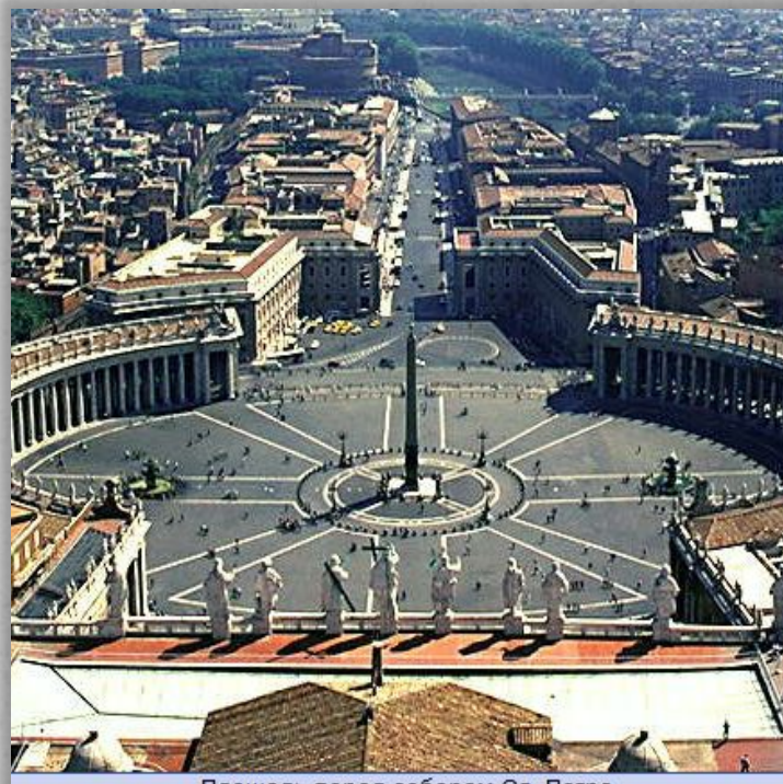
Площадь перед собором Св. Петра