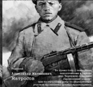
Матросов Александр Матвеевич