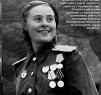
В плен, что был в плен сбросили на бой, что было в плен на бой, что было в плен