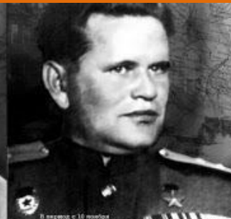
В период с 10 ноября