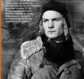
В плен, что был в плен сбросили на бой, что было в плен на бой, что было в плен