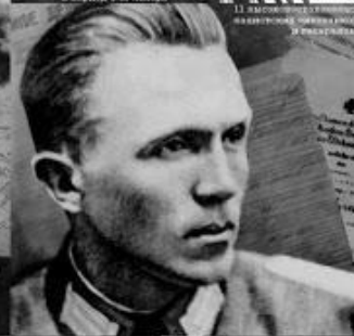
11 августа 1942 года вместе с полком и полком