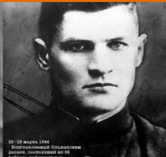
26-28 марта 1944 Воздушный бомбардировщик догора, сбрасывая из 50 кабин бомбы...