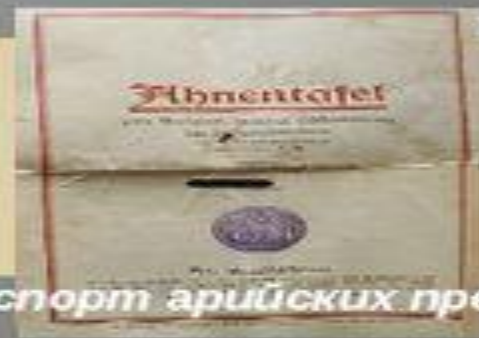
Паспорт арийских предков

Совокупность учений о физической и психической неравноценности рас