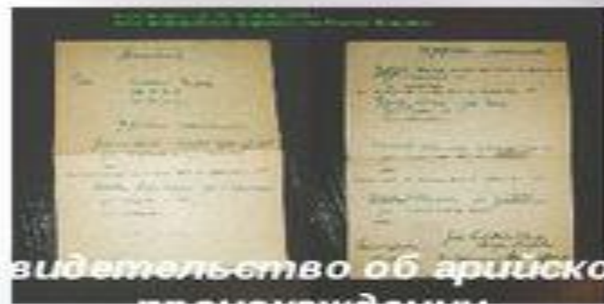
Свидетельство об арийском происхождении