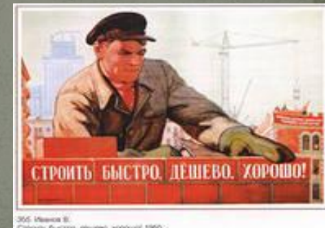
305 Иванова В. Строить быстро, дешево, хорошо! 1960