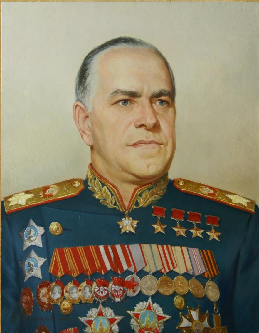
Георгий Константинович Жуков

Когда была разработана Берлинская операция, командующий 1-го Белорусского фронта маршал Советского Союза Г.К. Жуков дал указания командующим армиями сообщить, как только первая из них достигнет немецкой столицы. Главнейшей частью плана по ее захвату было водружение Знамени Победы над Рейхстагом.