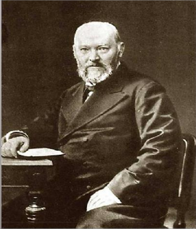
Отец- Николай Федорович Островский