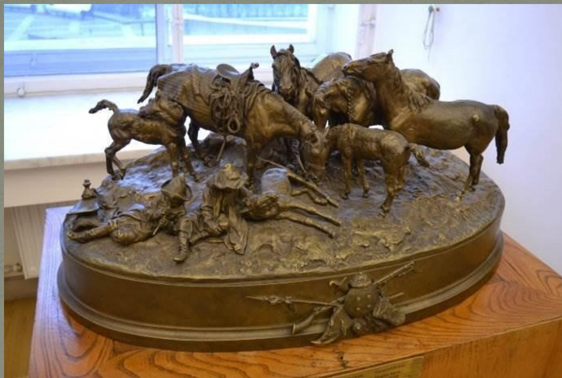
«Киргизский косяк на отдыхе». 1880 г. Бронза.