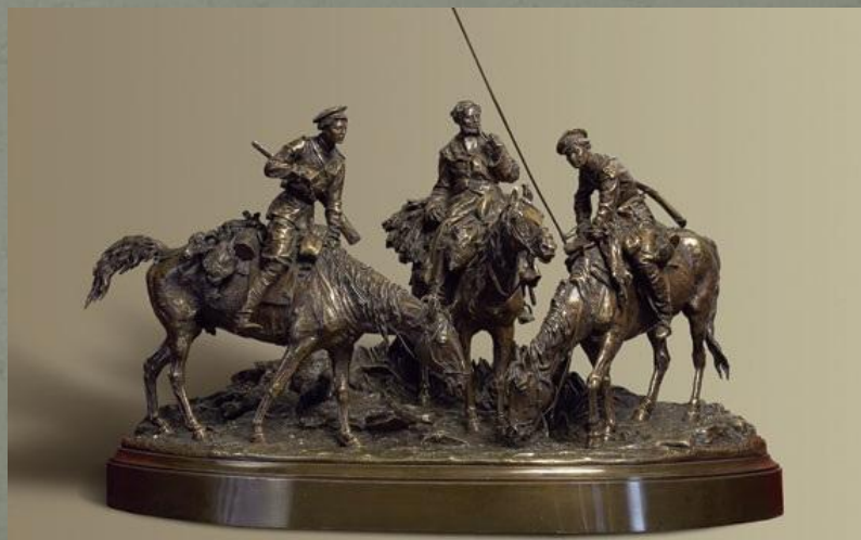
«Охотники с борзыми собаками». 1868 г.. Бронза.