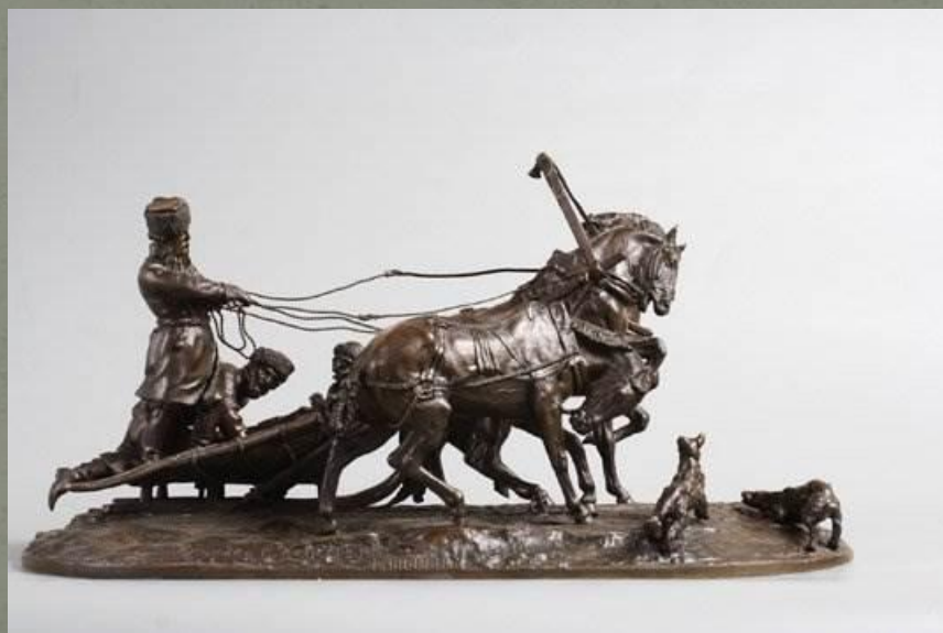
«Отъезжающая тройка». 1873 г. Бронза.