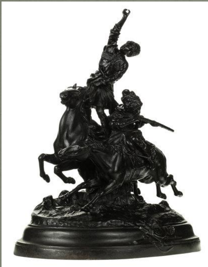
«Джигитовка лезгин». 1874 г. Чугунное литьё.