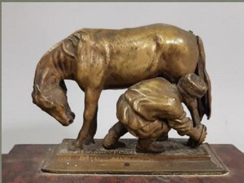
«Чистка лошади». 1870-е г.г. Бронза.