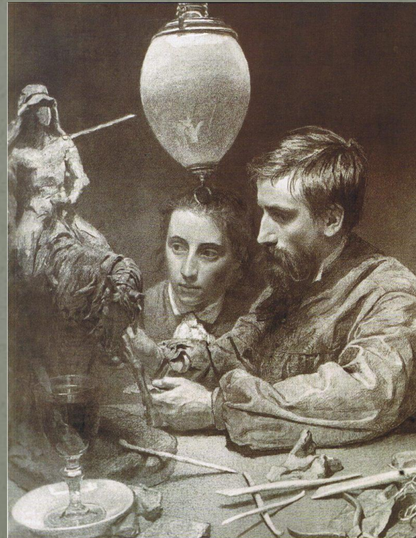
Евгений Александрович Лансере