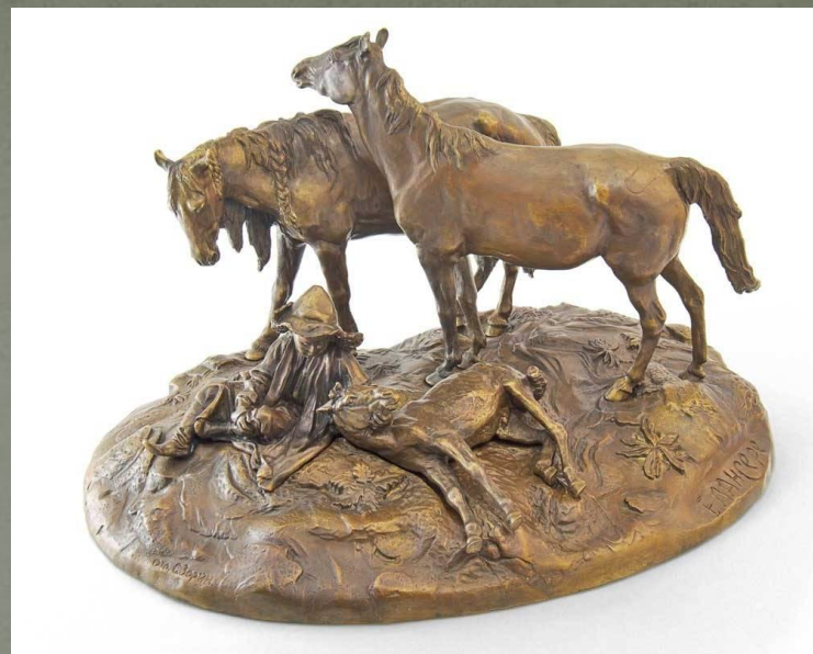
«Две лошади на отдыхе». Бронза.