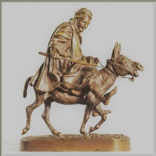
«Араб верхом на осле». 1880-е г.г. Бронза.