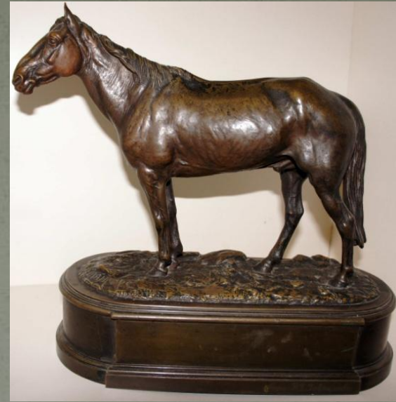
«Мальчик с лошадьми». 1800-е г.г. Бронза «Орловский рысак». 1870 г. Бронза.