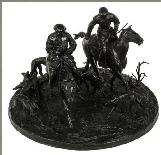
«Казачий разъезд». Чугунное литьё.