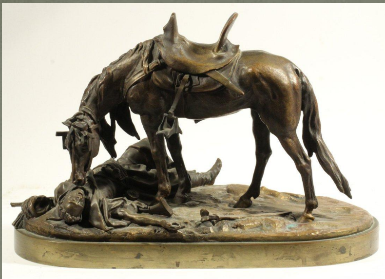
«Верный конь». 1884 г. Бронза.