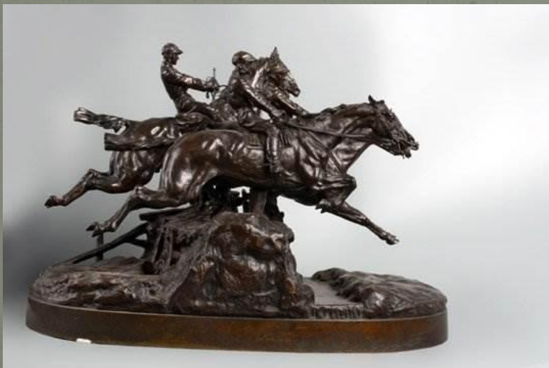
«Скачки с препятствиями». 1882 г. Бронза.