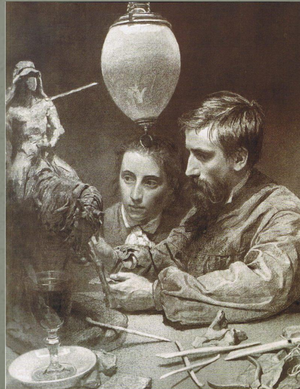
Евгений Александрович Лансере