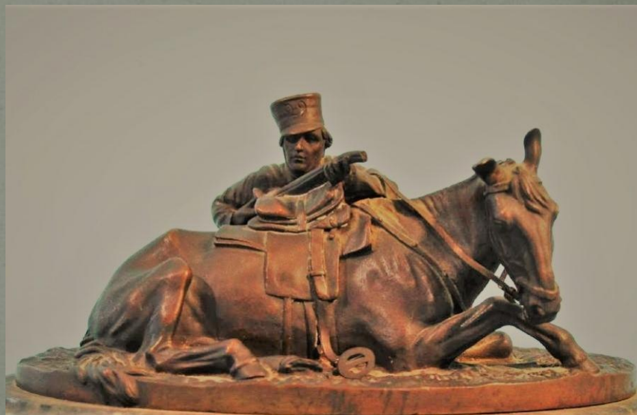
«Позади лошади». 1870-е г.г. Бронза.