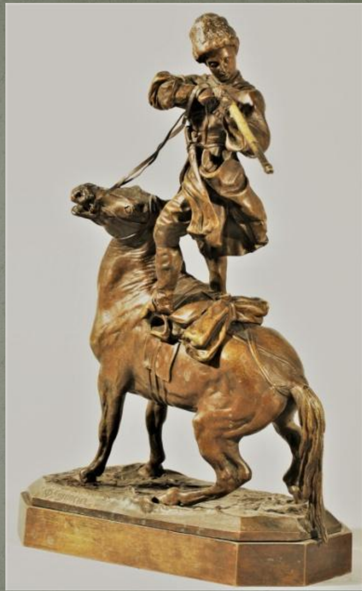
«Черкесская джигитовка». 1873 г. Бронза