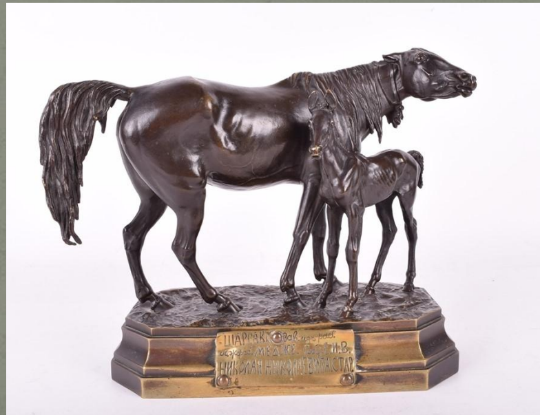
«кобыла Шарракия и жеребенок Медже». 1860-е г.г. Бронза.