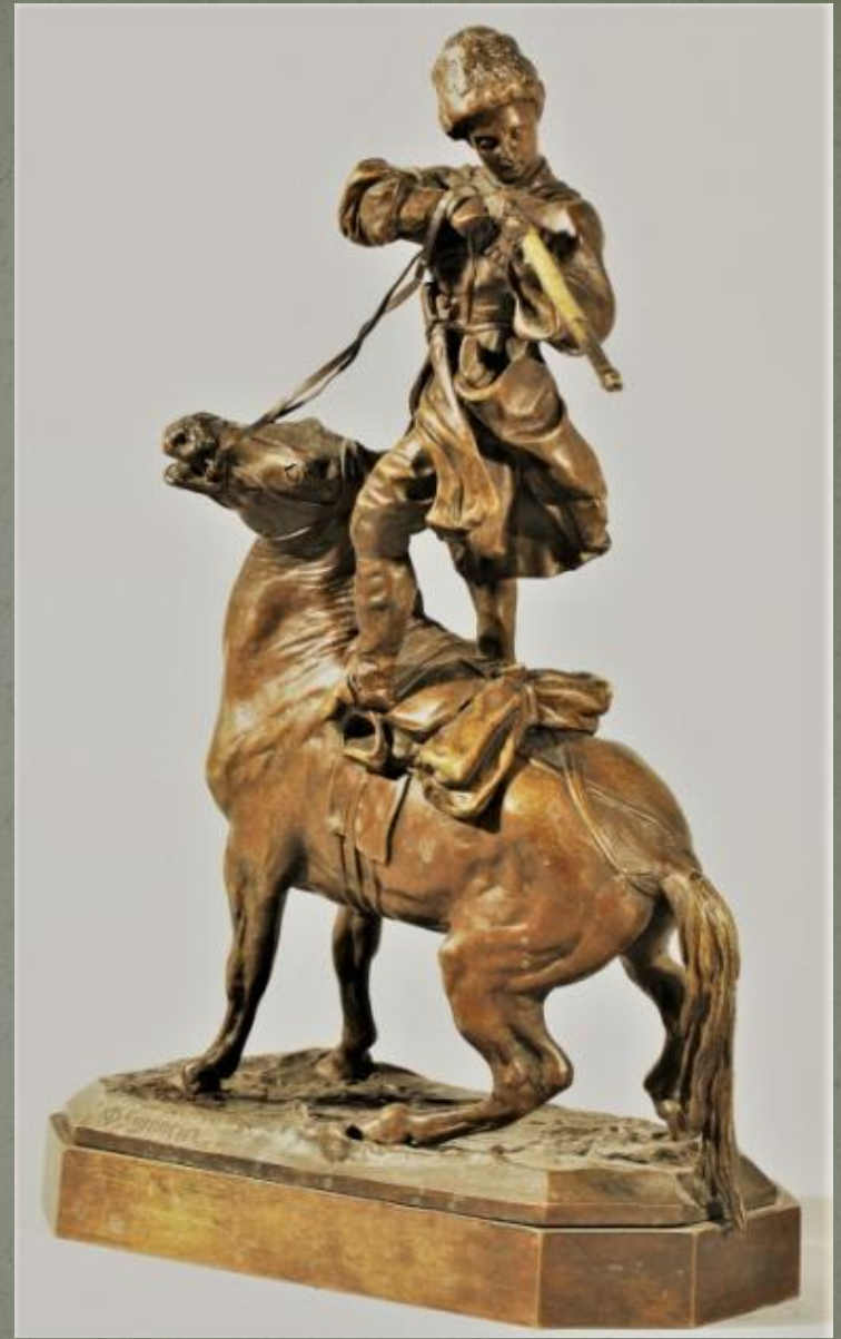
«Черкесская джигитовка». 1873 г. Бронза