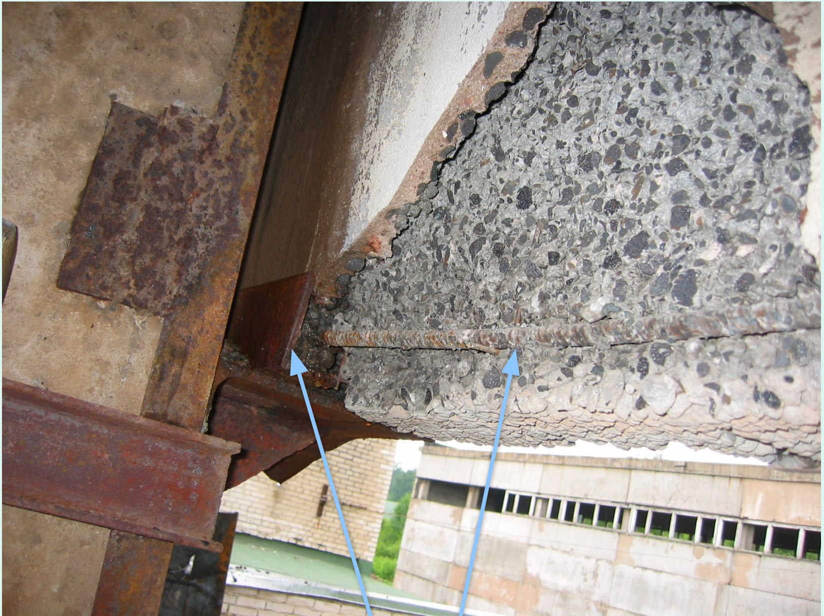
Отслоение защитного слоя бетона стеновой панели. Оголение и деформирование арматуры и закладных деталей.