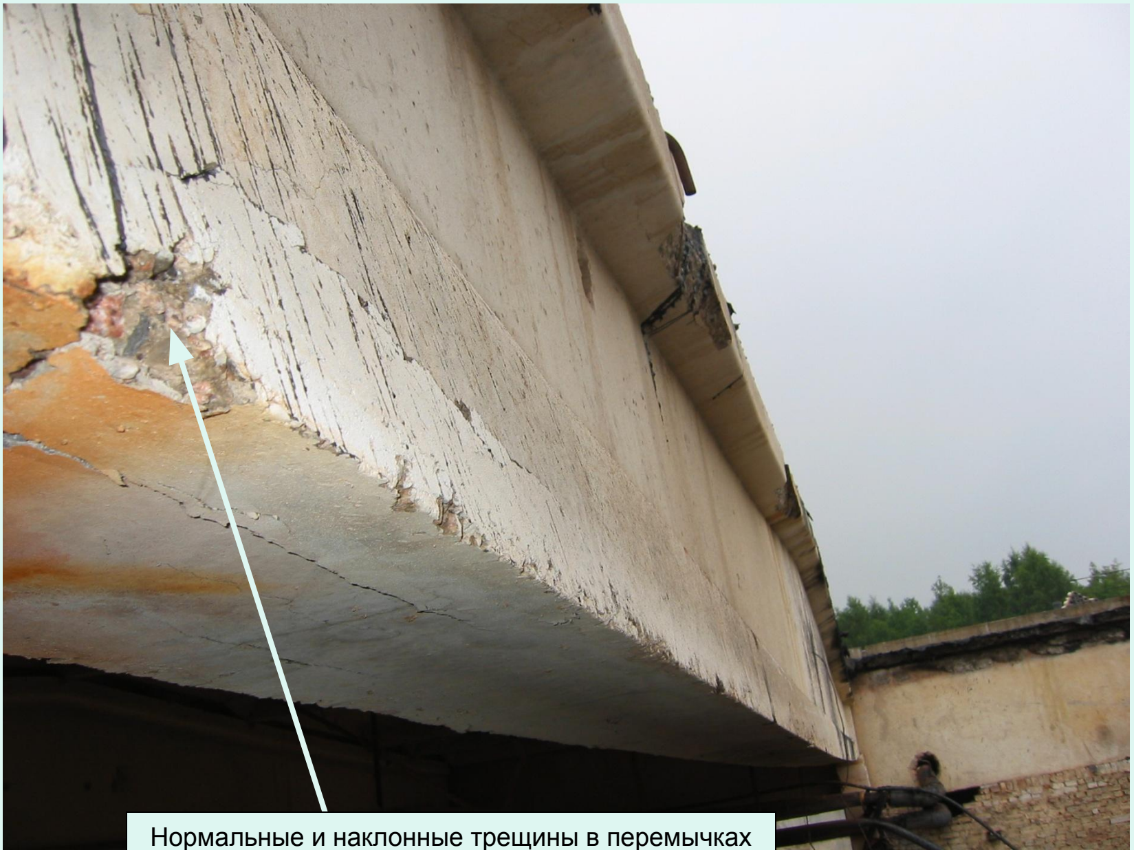
Нормальные и наклонные трещины в перемычках над проемами ленточного остекления. Продольные трещины под местами расположения арматуры