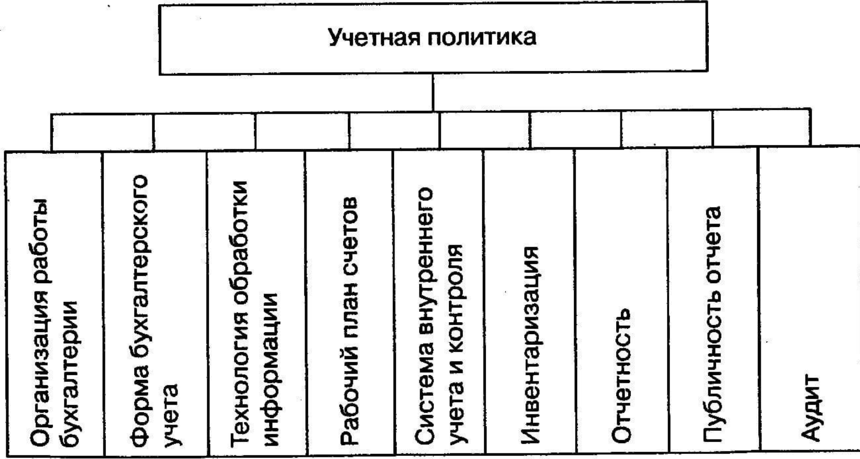
Рис. 9.6. Организационно-технический аспект учетной политики