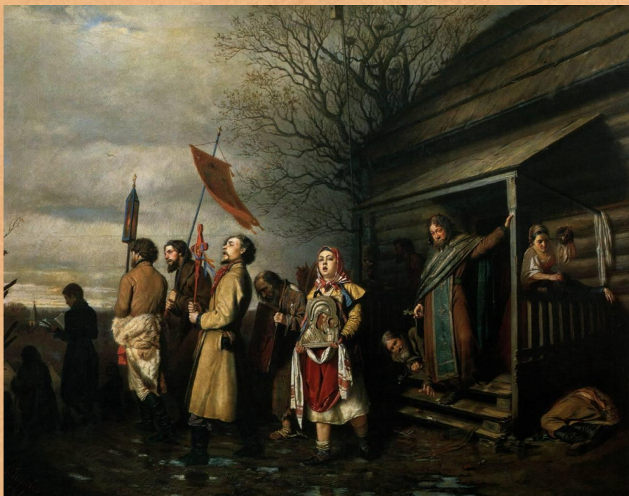
Сельский Крестный ход в старину

Крестный ход - это торжественное шествие служителей церкви и прихожан (люди, которые пришли в церковь) под звон колоколов навстречу воскресшему Христу