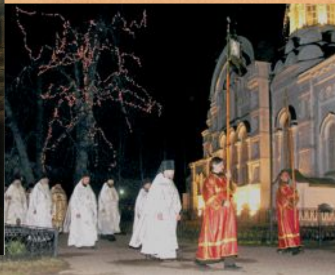
Современный Крестный ход