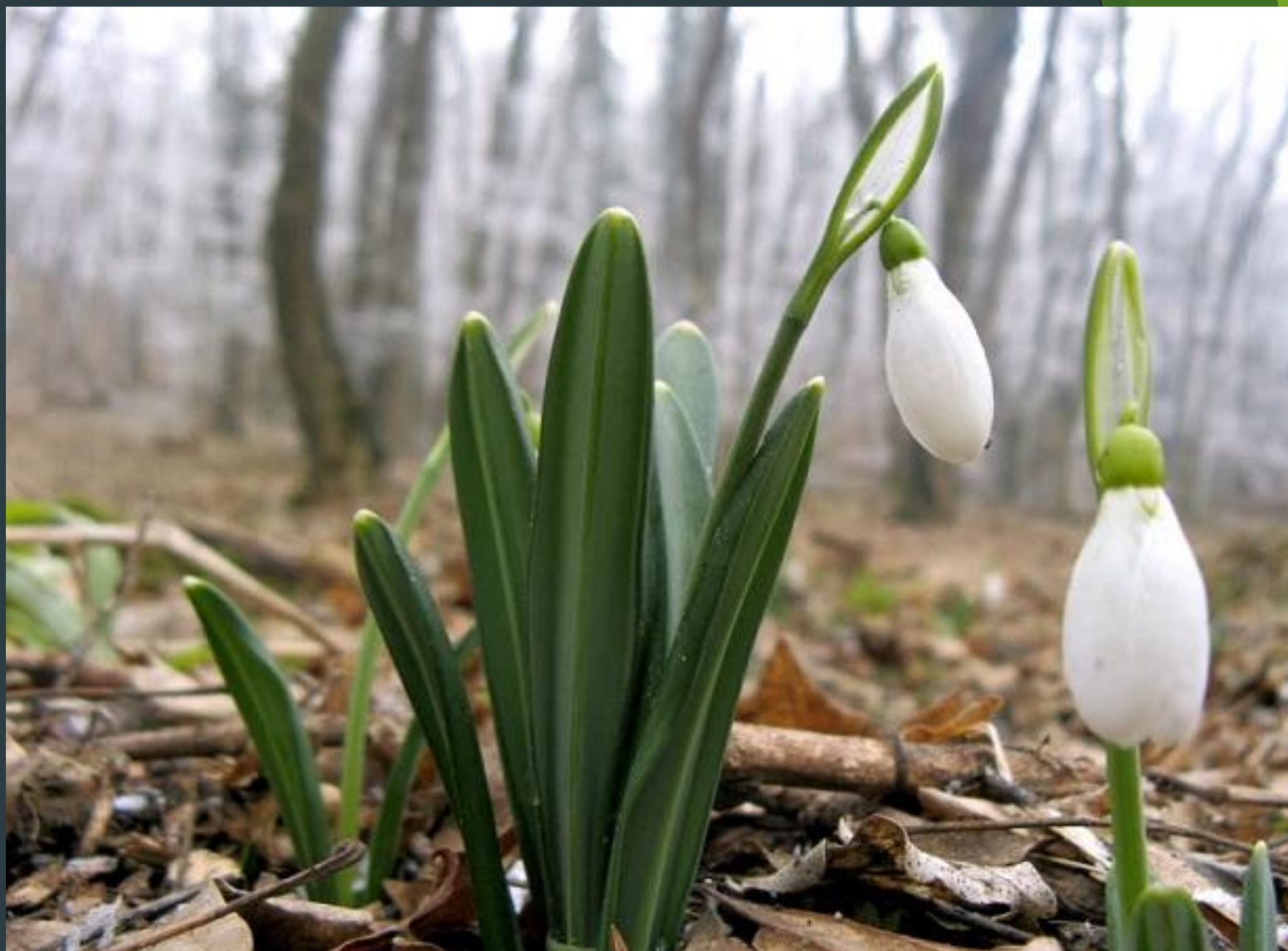
Покрытосемянные Подснежник плосколистный