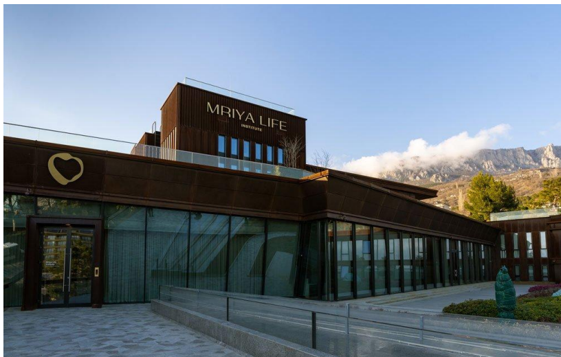
Здание Mriya Life Insitute