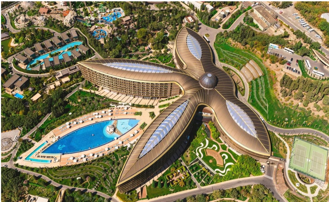
Санаторно-курортный комплекс "Mriya Resort & SPA", п. Оползневое

Проектировщиком будущего комплекса стал знаменитый архитектор Норман Фостер