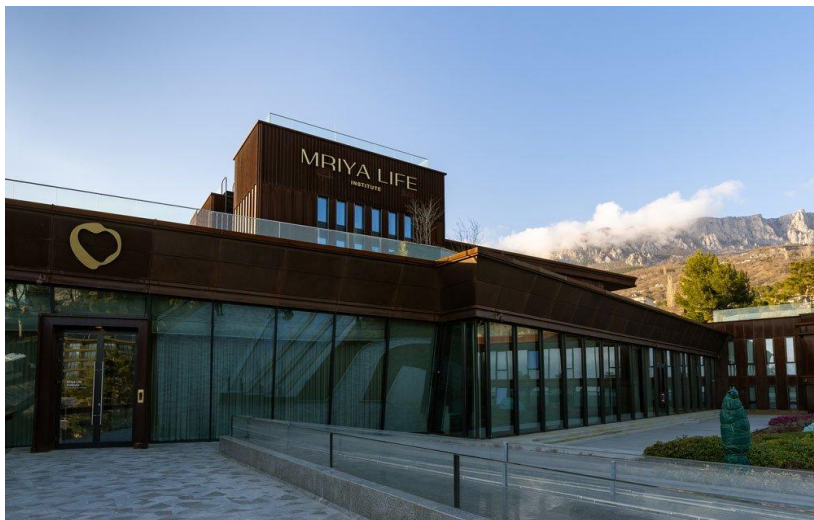
Здание Mriya Life Insitute