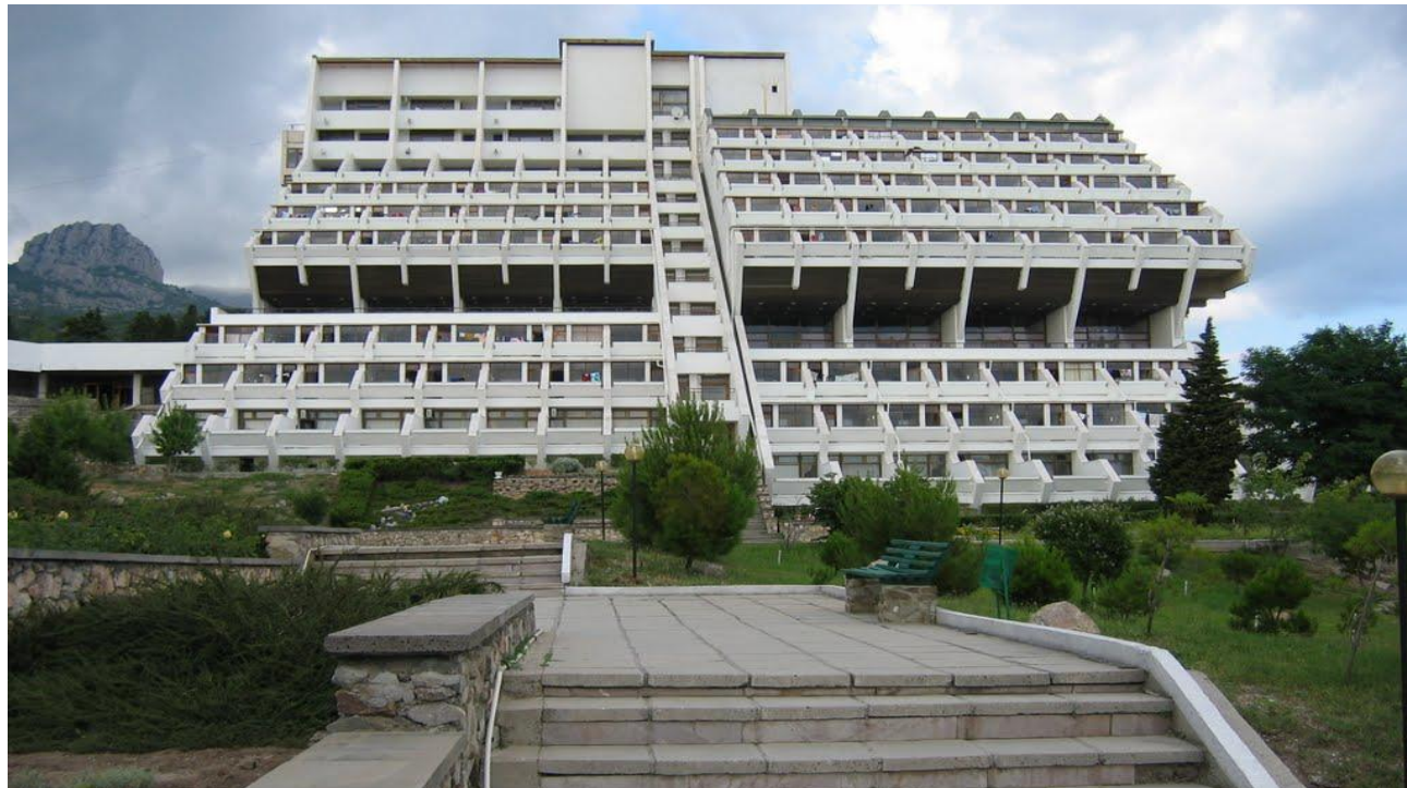
Пансионат «Мрия», п. Понизовка

История развития курорта началось еще с 1970-х годов. На берегу Черного моря в поселке Оползневое был построен пансионат со специфичным стилем