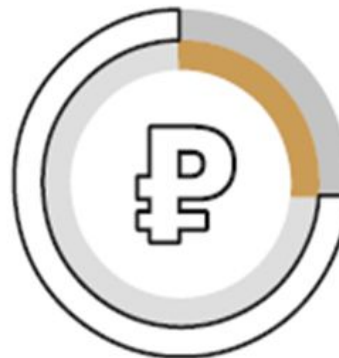
Общий бюджет проекта

Для событийных проектов должен быть четко описан социальный эффект (что дает проведение мероприятия)