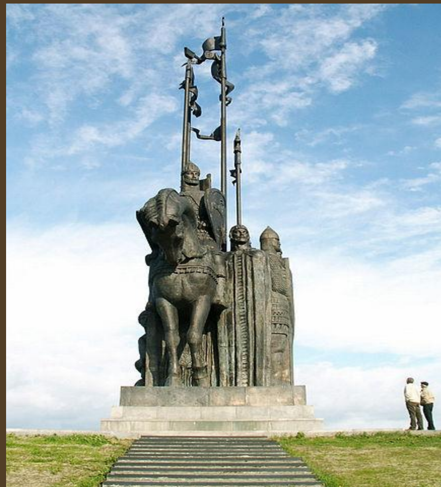
Памятник дружинам Александра Невского установлен в 1993 году, на горе Соколиха в Пскове, удалённой почти на 100 км от реального места сражения.