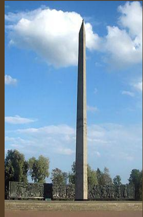
Псков. Монумент в честь первых боёв Красной армии в Крестах (1969 г.).

День защитника Отечества — праздник, отмечаемый 23 февраля в России, Белоруссии, на Украине, в Кыргызстане и в Приднестровье . Был установлен в СССР в 1922 году как День Красной армии и Флота. С 1949 до 1993 г. носил название «День Советской Армии и Военно-Морского флота». После распада СССР праздник также продолжают отмечать в ряде стран СНГ. В связи с распространённым в обществе стереотипом о том, что полноценными «защитниками Отечества» являются лишь мужчины, а также в связи с празднованием «8 марта» Международного женского дня, День защитника Отечества часто позиционируется и воспринимается на неформальном уровне как «день всех мужчин».