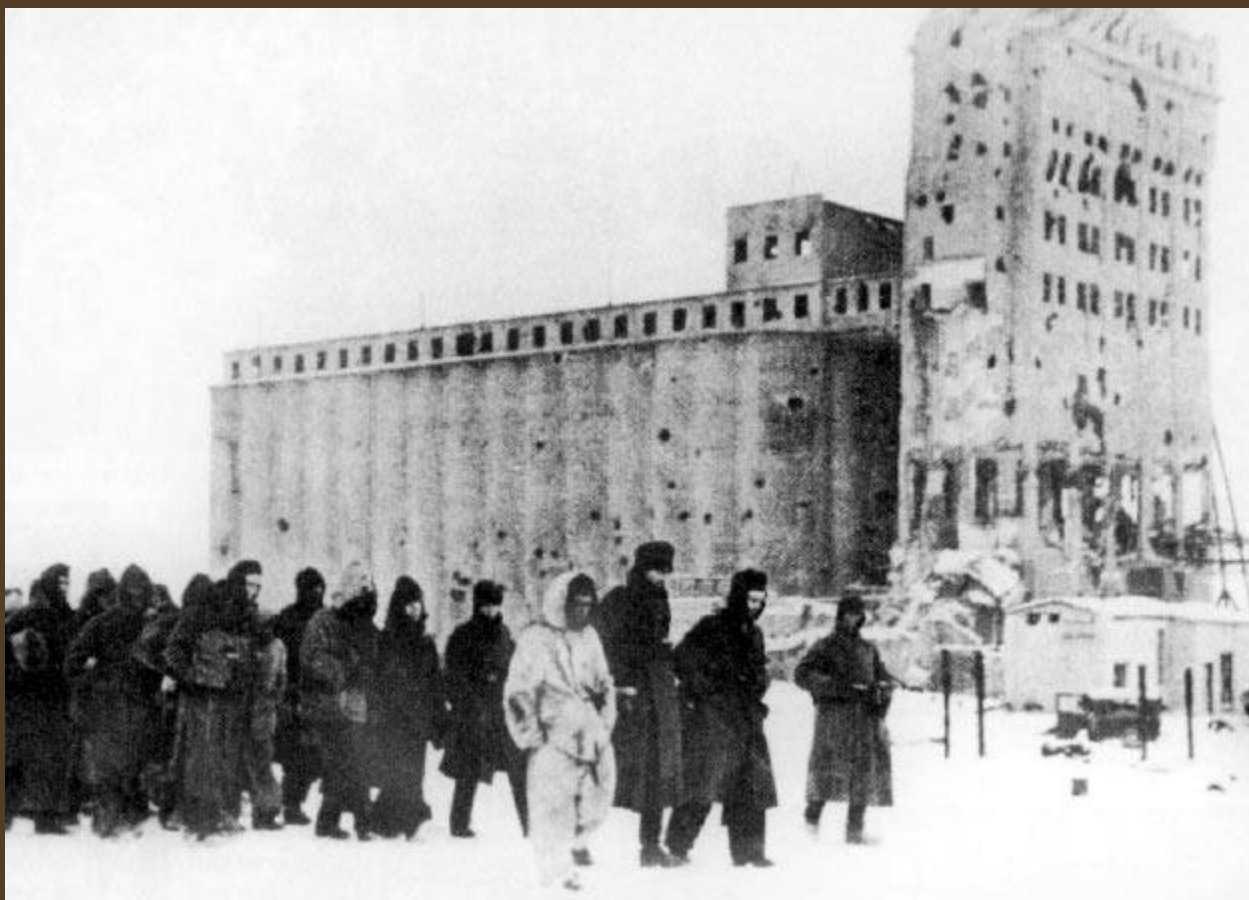
Пленённые под Сталинградом немецкие солдаты. Февраль 1943 года