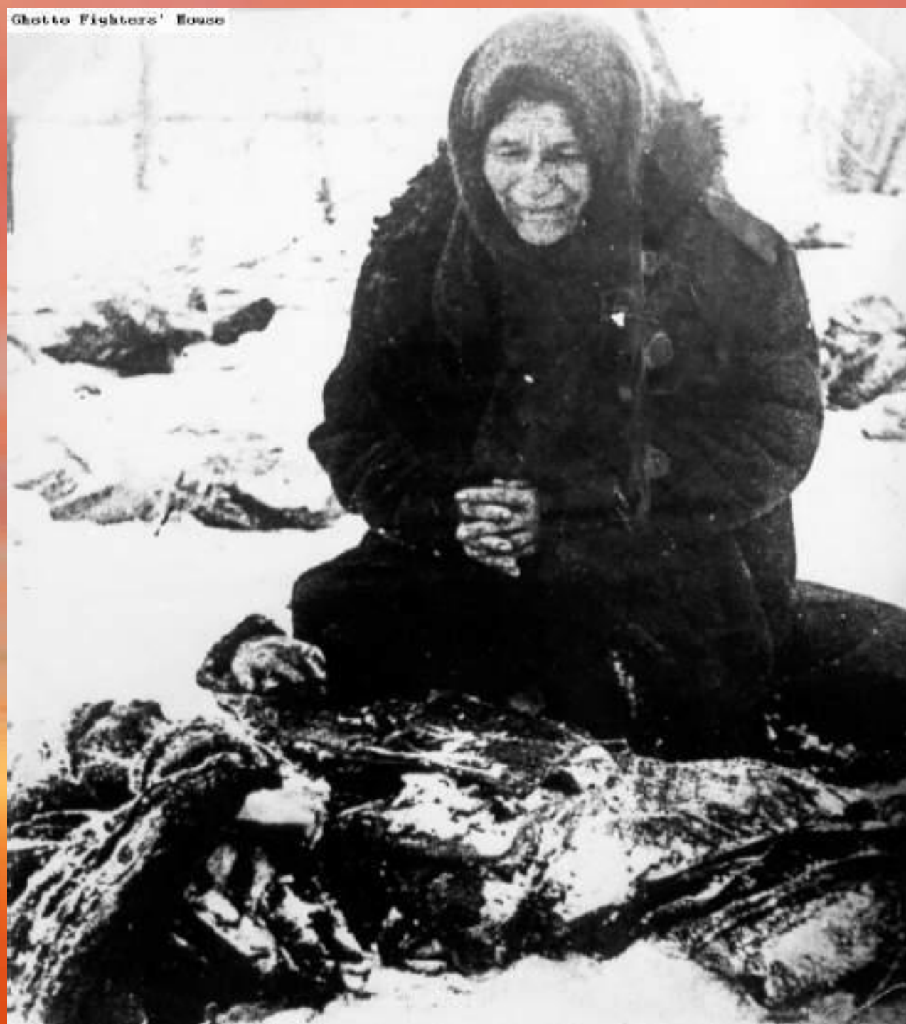
Ghetto Fighters' House