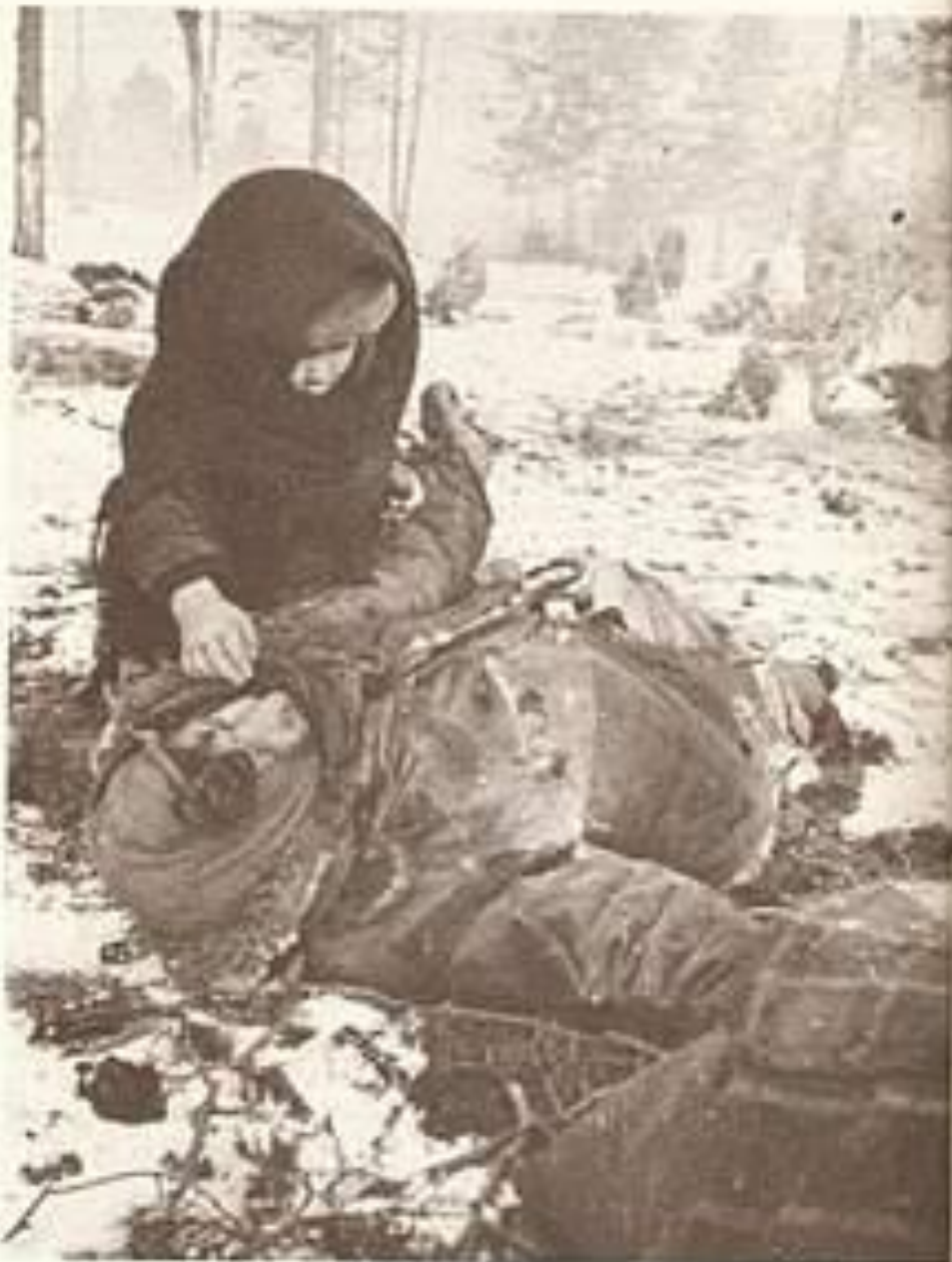
Ein Kind an der Leiche seiner Mutter, umgekommen in einem KZ für Zivilisten, nahe der Ortschaft Czestoch.