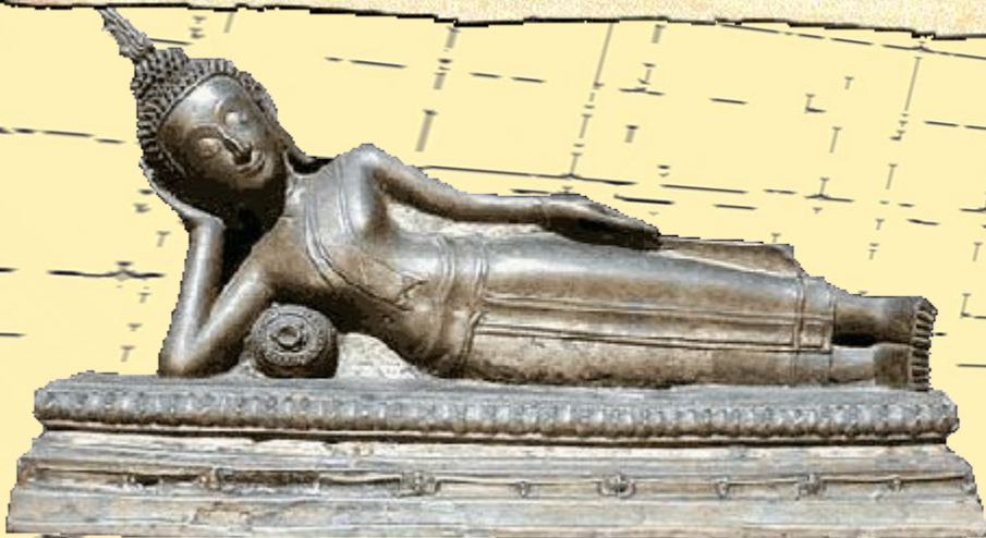
Будда. Кон. III-II вв. до н.э.

ГЛАВНОЕ — ЛИЧНОЕ ДОСТОИНСТВО ЧЕЛОВЕКА, А НЕ ЕГО ПРОИСХОЖДЕНИЕ.