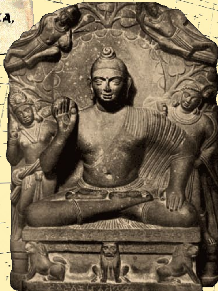
Будда на постаменте со львами