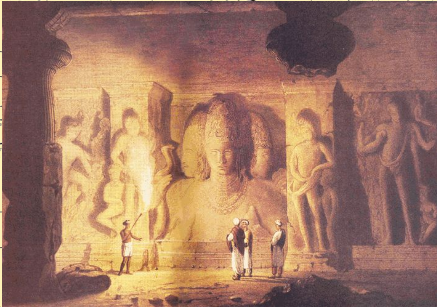
Храм в скалах о. Элефанта (VI в. до н.э.)