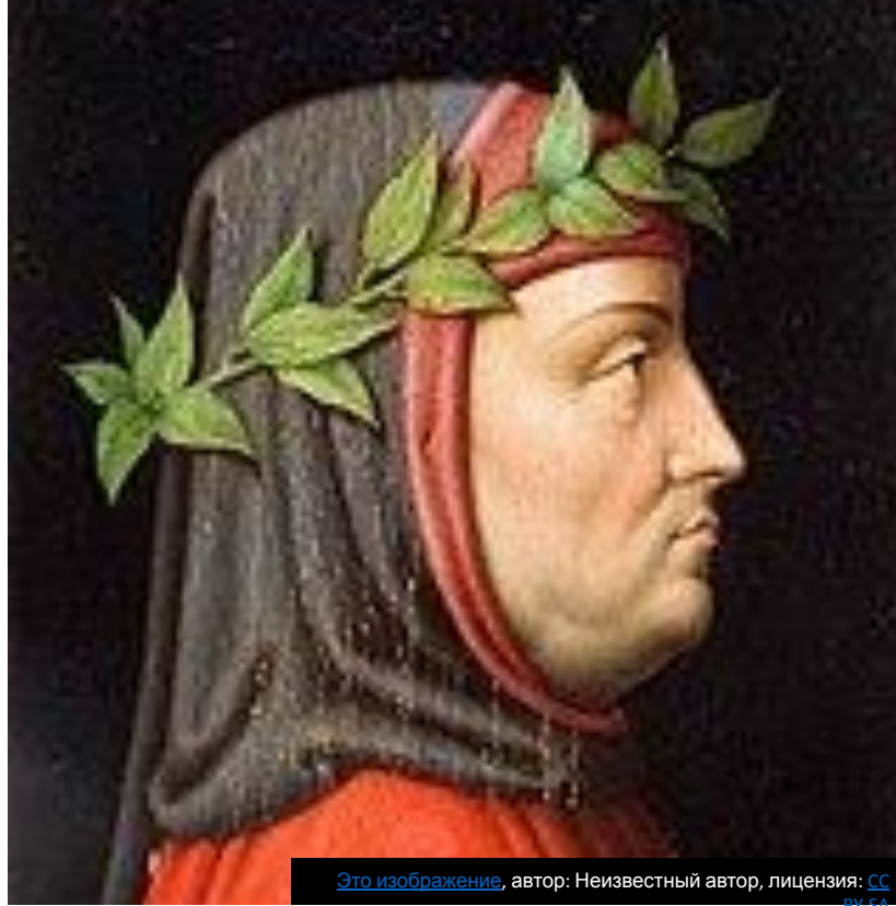
Это изображение , автор: Неизвестный автор, лицензия: CC BY-SA