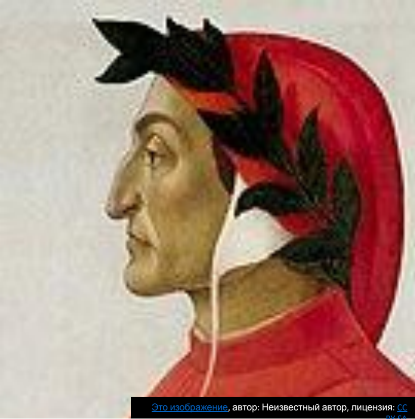
Это изображение , автор: Неизвестный автор, лицензия: CC BY-SA