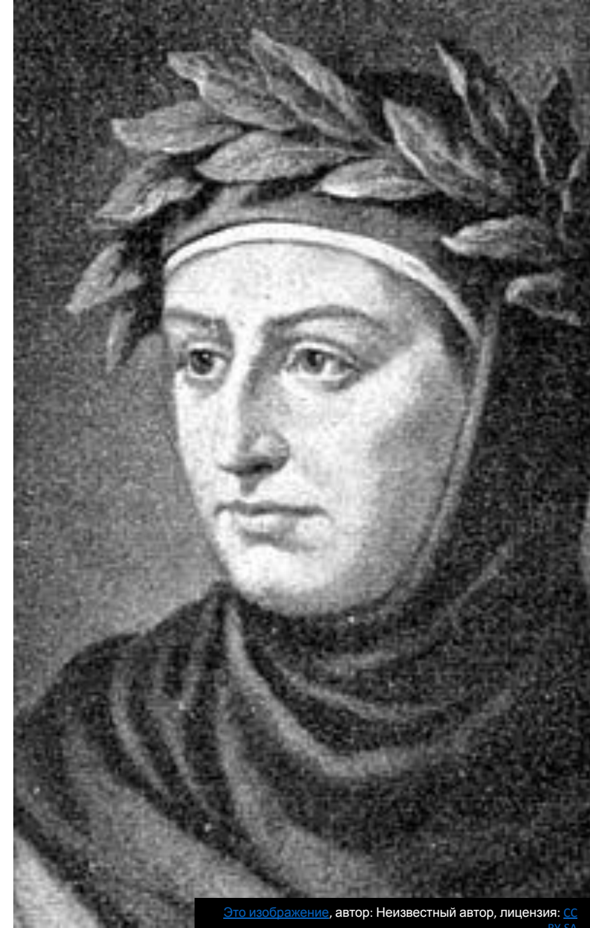
Это изображение , автор: Неизвестный автор, лицензия: CC BY-SA