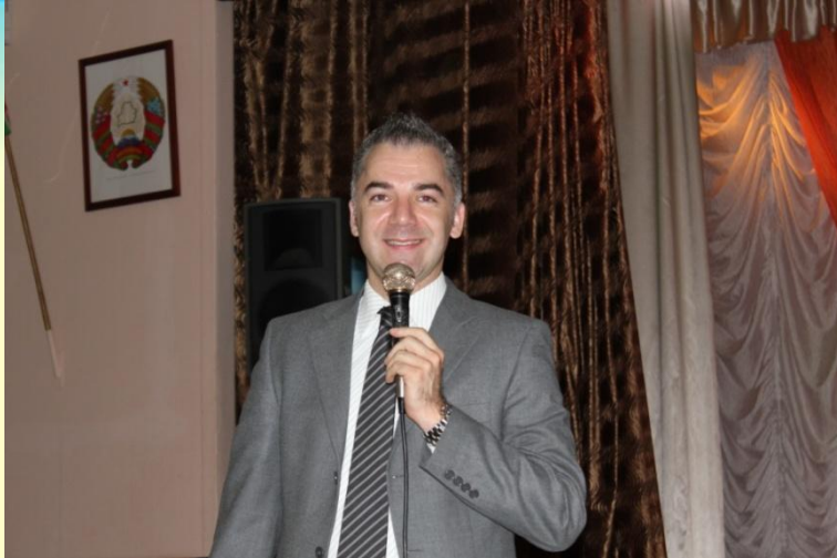
Советник Посольства Франции господин Людовик Руайе