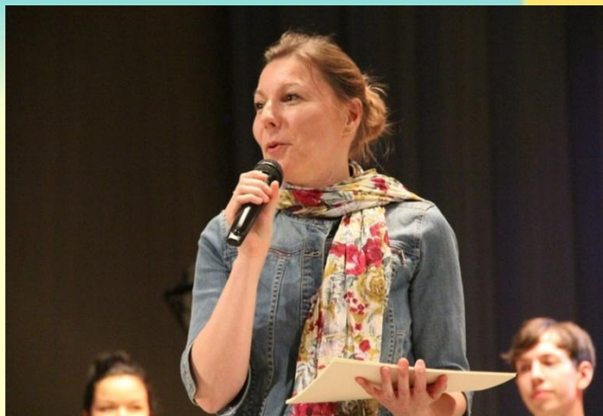
Атташе по сотрудничеству в области французского языка госпожа Клер Элиз Юбер