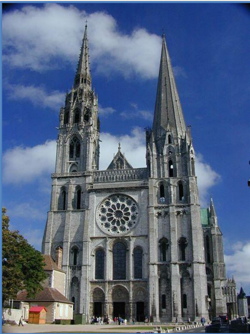
Шартрский собор. Франция