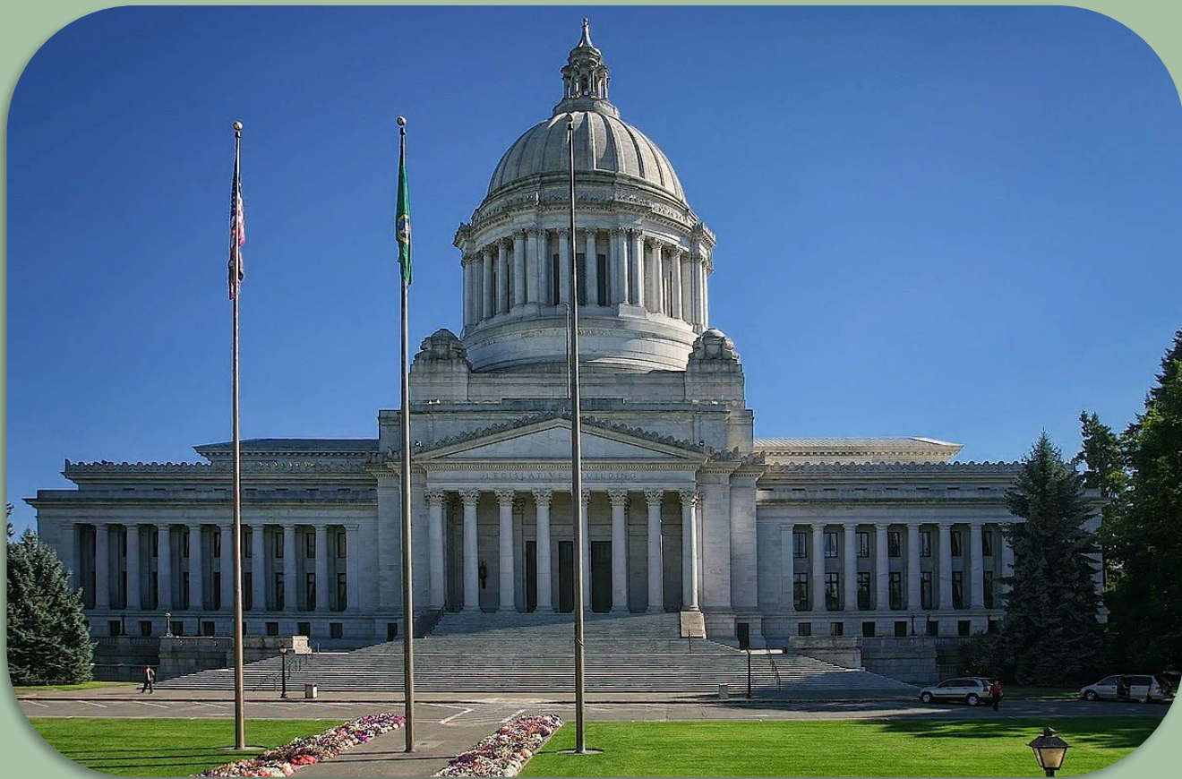
Капитолий штата Вашингтон