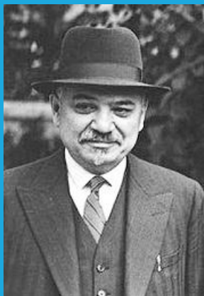
И. М. Майский 1924