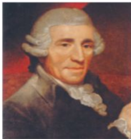
Йозеф Гайдн (1732—1809)

ВЕНСКИЕ КЛАССИКИ ГАЙДН • МОЦАРТ • БЕТХОВЕН КВАРТЕТ