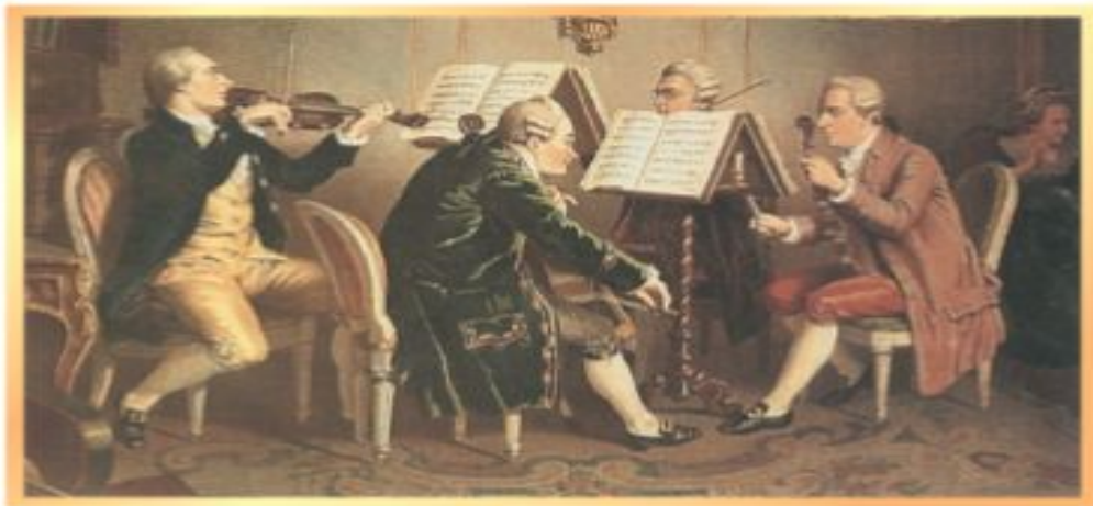
Неизвестный художник. Струнный квартет

С творчеством венских классиков связан расцвет таких жанров, как опера, симфония, соната, концерт, квартет. Некоторые из них нам уже известны, с другими мы познакомимся впервые.