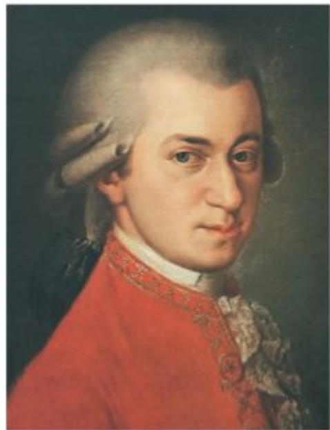
Б. Крафт. Портрет Вольфганга Амадея Моцарта

Творчество Й. Гайдна, В. А. Моцарта, Л. Бетховена мы ценим за жизнеутверждающий характер, ясность и выразительность музыкального языка. При этом музыка каждого из этих композиторов имеет свои яркие особенности.