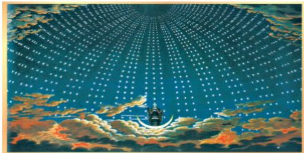
К. Ф. Шинкель. Царица ночи

Повелительница мрака и зла, коварная Царица одержима идеей власти над миром. Она стремится победить мудрого правителя Зарастро и захватить его талисман — священный солнечный диск.