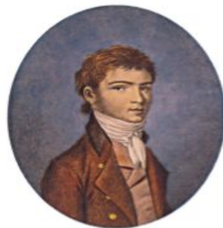
Людвиг ван Бетховен (1770—1827)

композиторов — Йозефа Гайдна, Вольфганга Амадея Моцарта, Людвига ван Бетховена . Их называют венскими классиками . Венскими — потому что значительная часть их творческой жизни была связана с Веной (столицей Австрии). Классиками — потому что созданные ими произведения получили всемирное признание как выдающиеся, образцовые.