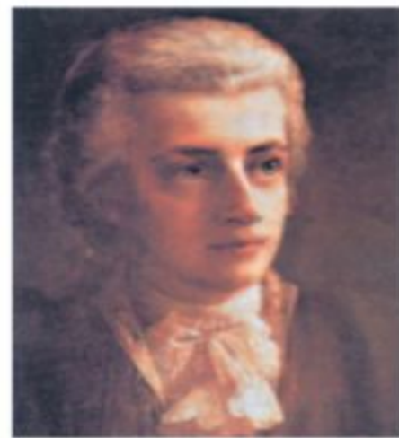
Вольфганг Амадей Моцарт (1756—1791)