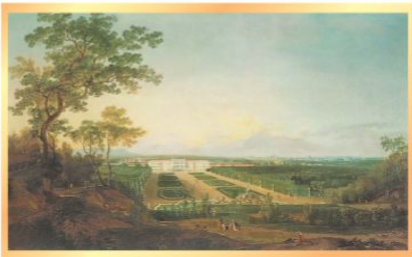
Вена во времена Моцарта

С давних времён крупнейшим музыкальным центром Европы является Австрия. С этой страной связаны имена многих выдающихся композиторов, дирижёров, исполнителей. Славится Австрия и своими музыкальными фестивалями, конкурсами, концертами.