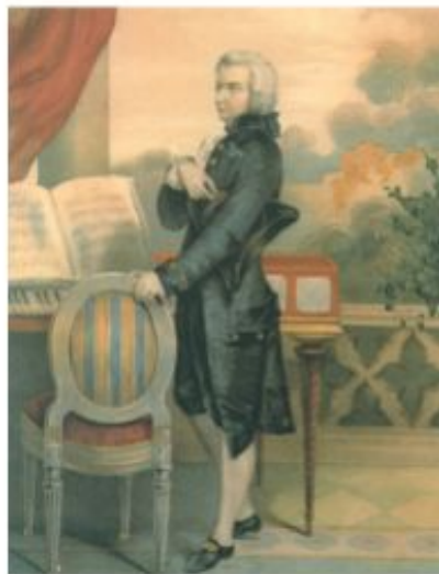
Неизвестный художник. Портрет Моцарта

Творчество Й. Гайдна, В. А. Моцарта, Л. Бетховена мы ценим за жизнеутверждающий характер, ясность и выразительность музыкального языка. При этом музыка каждого из этих композиторов имеет свои яркие особенности.